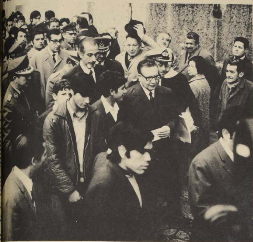
POR LA CALLE Y JUNTO AL PUEBLO, caminó ayer el Compañero Presidente. Allende asistió al acto inaugural de la Asamblea del Programa de Naciones Unidas para

● Momios le tienen miedo al "cuco" marxista.- ● Decidieron ser menos "adiposos" en el futuro.