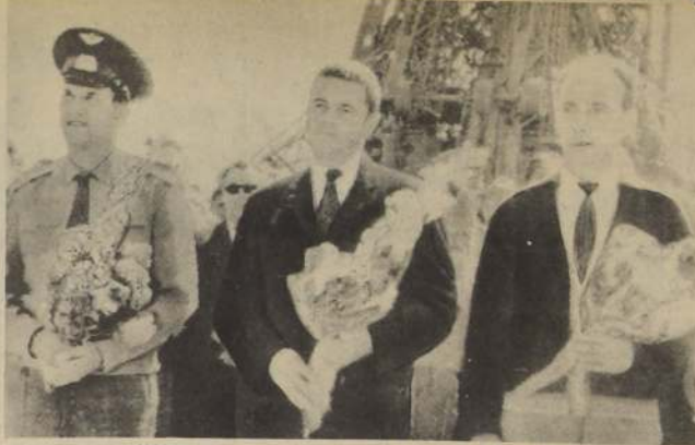
MOSCU. Los tres astronautas soviéticos que partieron de la Tierra rumbo al espacio y que ahora se encuentran a bordo de la estación espacial Saliut, aparecen en el grabado horas antes de emprender tan histórica misión, con hermosos bouquets de flores que les obsequiaron para desearles buena suerte. Ellos son, de izquierda a derecha: Jefe de la Misión, comandante, Georgi Dobrovolski, ingeniero de vuelo, Vladislav Volkov y el ingeniero de pruebas, Viktor Patsaev.

Después del enganche entre "Soyuz 11" y "Saliut", el Comandante del vuelo Dobrovolski, anunció que los cosmonautas se sienten bien y están realizando el programa previsto. La Tass concluye afirmando