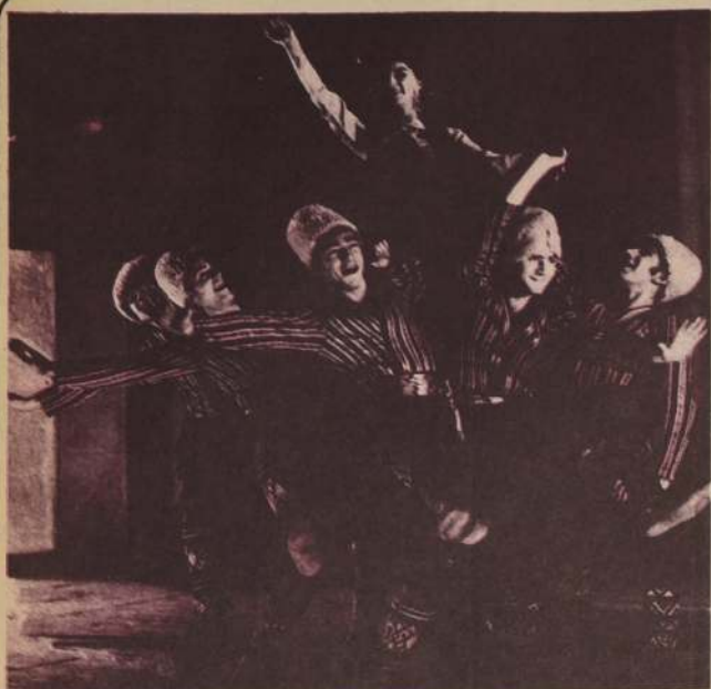
Alegria de vivir, gracia melódica y vigor rítmico en una de las danzas populares que ofrece el CONJUNTO ESTATAL DE ARMENIA.