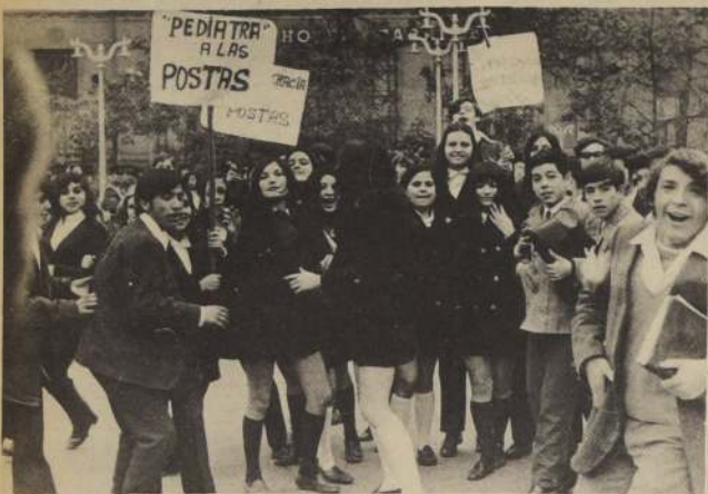
ESTUDIANTES DEL SECTOR Quinta Normal colaboran a solucionar los problemas hospitalarios. Ayer, públicamente, su deseo de manifestar.

Alumnos del Sector Quinta Normal iniciarán campaña de recolección de medicamentos y elementos sanitarios