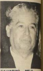
GALVARINO MELO, Director General del SSS, en cincuenta años, de la labor que ha realizado.

A este acto han sido invitados dirigentes de la CUT nacional y provincial, las federaciones mineras de la construcción, textil y del metal, así como los sindicatos de la industria textil, directivos de los pensionados, etc.