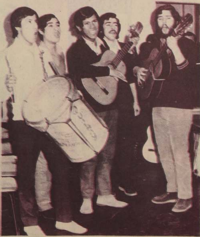
CONJUNTO QUILMAY. Cinco jóvenes voces se han unido para difundir nuestra música. Los comienzos fueron difíciles como lo son en todos los artistas nuevos, pero ya pueden decir con orgullo que "se matieron" y van por un buen camino. ¡Siguen adelante, tiren para arriba!