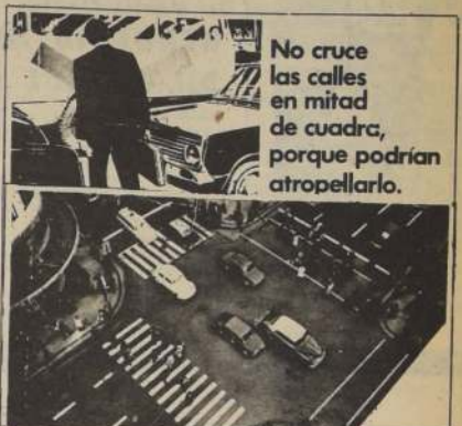
No cruce las calles en mitad de cuadra, porque podrían atropellarlo.