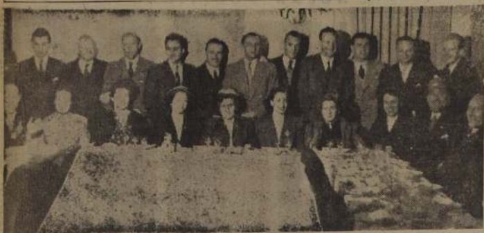
EN EL CHATHAM CLUB DEL DANUBIO AZUL.—Almuerzo ofrecido por el conjunto argentino-irlandés de hockey sobre césped. Hurling Club, a sus contendores chilenos. El equipo bonaerense ofreció este ágaso en retribución a las múltiples atenciones de los deportistas santiaguinos.