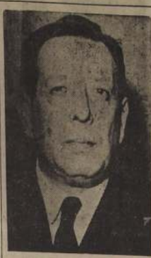
Senador Francisco Bulnes

otra de las figuras líderes del liberalismo, que se resistió a ir a una derrota segura, dadas las condiciones en que lo colocaba la Junta Ejecutiva.