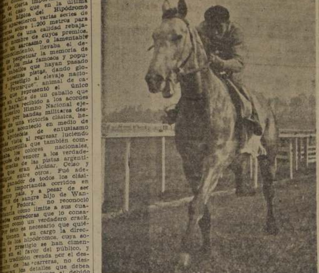
FANTASMA GRIS, si encuentra una pista firme, puede encargarse de batir al favorito Sao Paulo en la condicional de tercera hora, sobre 2.000 metros. El torbellino ha completado sus formas y estará fuertemente cotizado.