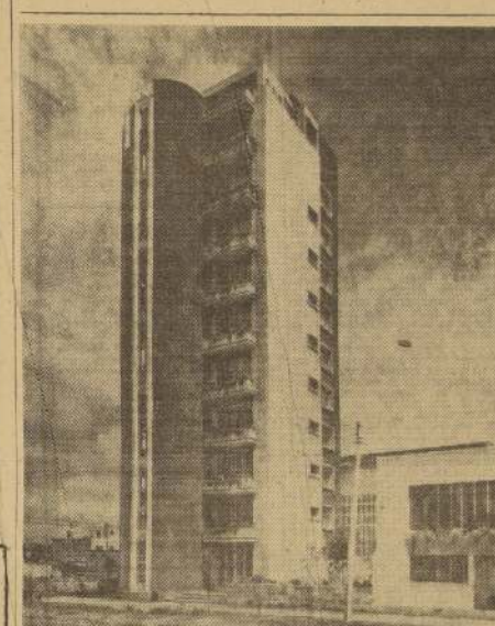
EDIFICIO de Ciudad de México, diseñado por el arquitecto Mario Pani, que revela una nueva concepción de líneas.

Pero el objeto a que debemos arribar en la Escuela de Arquitectura, donde se trabaja con alumnos recién iniciados, no es a lo más y concluyente sino a lo básico e indispensable que debe saber el arquitecto en materia de dibujo. Luego el ejercicio y la práctica irán desarrollando los conocimientos adquiridos, de acuerdo a las facultades y capacidad de cada uno. Del caudal de conocimientos que constituyen una ciencia, o bien la teoría y técnica de un arte, es preciso apartar todo aquello que no es indispensable, y del resto apartar aún más todo lo que el estudiante no puede aprender por falta de tiempo o por falta de preparación inicial. Ortega y Gasset nos di-