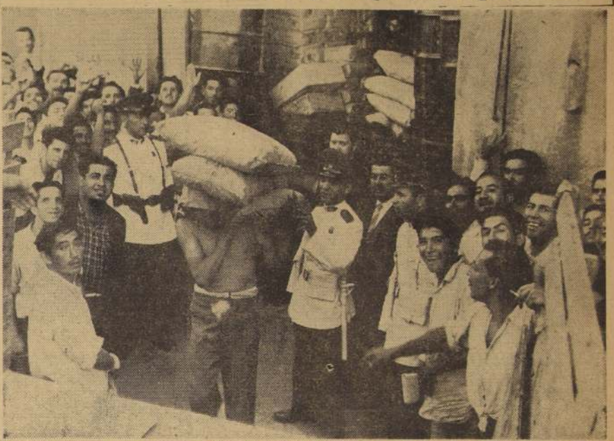
El grabado corresponde a la requisición de 497 sacos de azúcar del almacén de calle Salas 246, efectuado a las 17 horas de ayer. Un abigarrado mitin popular aplaudió la energía con que está actuando la autoridad para defender a los consumidores, del comercio especulativo, a la vez que condenó a viva voz a los afectados con la sanción. El negocio fue clausurado por 30 días. El azúcar se venderá al menudeo en el Mercado Presidente Ríos.