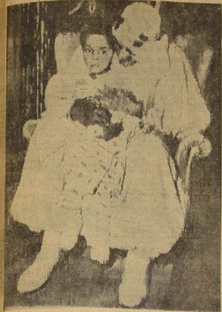
WASHINGTON.— El Rey Saud, de Arabia Saudita, aparece junto a su hijo cuando se lleva para una revisión médica.