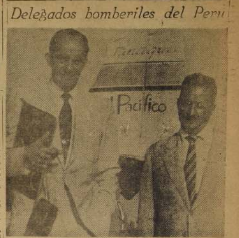
Delegados bomberiles del Perú