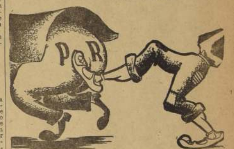
EL PUEBLO LOS ARROJO DEL PODER Y NO VOLVERAN