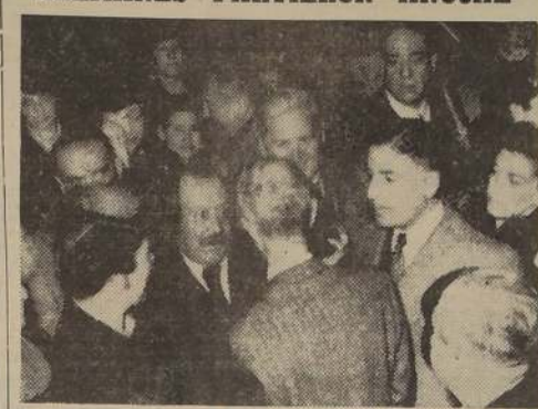
El ex Embajador alemán, Barón von Schoen, es despedido en los andenes de la Estación Mapocho

Anoché a las 22 horas en punto, partió de la Estación Mapocho el tren que conducía a la Argentina a los ex diplomáticos y algunos residentes alemanes, que despididos por el ex Embajador alemán Barón von Schoen, y de acuerdo con las disposiciones contenidas en el acuerdo diplomático de canje debieron abandonar el país.