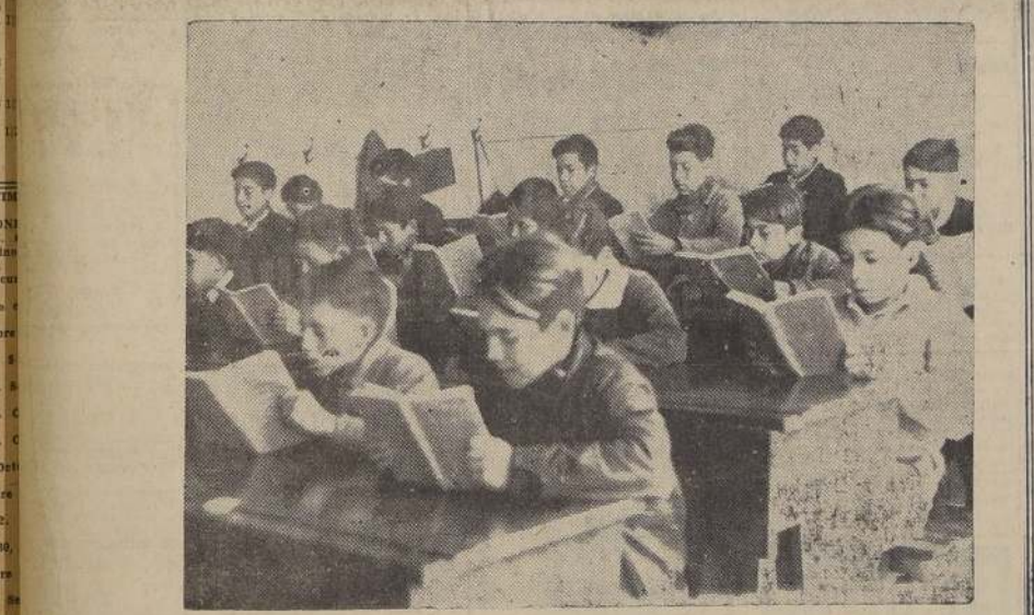
HIJOS DE OBREROS EN LA ESCUELA

Fija la atención en sus textos de estudio, en este grupo de pequeños alumnos de una escuela primaria de la Compañía de "Cemento Melón", se precisan las características de tesorería constancia y de enérgica decisión que marca la estatura física y moral del obrero chileno. Función social que ha sido comprendida como esencial en Chile, la educación del hijo del obrero es puesta en práctica por esta empresa que inteligentemente advierte que en su pueblo, en su mejoramiento social, tiene Chile el mejor seguro contra la incapacidad creadora. Estos muchachitos, alumnos hoy, serán mañana los obreros especializados que desentrañen los secretos de complicadas maquinarias, y al poner en marcha el motor de sus mecanismos muevan también en marcha hacia adelante el porvenir de la grandeza de Chile. Esta estampa fué tomada hace días en La Calera por los fotógrafos de El Suplemento de "La Nación" sobre "El Trabajo de Chile".