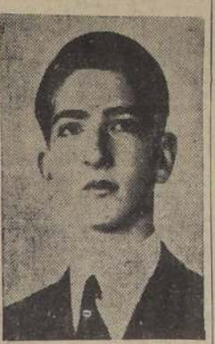
S. M. Pedro II de Yugoslavia

EL CAIRO, 29.—(U. P.).— Llegó a esta capital el Rey Pedro de Yugoslavia. Según se ha anunciado anteriormente, el propósito del viaje del monarca yugoslavo al mediano oriente, es encontrarse más próximo a su patria, para poder cooperar en forma más efectiva en el caso de que los aliados emprendan operaciones contra los alemanes en los Balcanes. A pesar de que nada se ha informado oficialmente, se manifiesta la creencia de que el Rey Pedro recibirá próximamente la visita de su Ministro de Guerra y jefe de guerrilleros patriotas, general Dragica Mihailovich, con el objeto de buscar la forma de obtener una mayor coordinación entre los esfuerzos de los patriotas yugoslavos y las fuerzas aliadas en las futuras operaciones. EVACUACION DE SPLIT Entretanto, la radio de las Naciones Unidas en Argel transmitió un comunicado del ejército yugoslavo de liberación, anunciando que el puerto de Split (Spalato) "fué evacuado a causa de la presión ejercida por el enemigo, después de encarnizada lucha". Fueron salvados todos los pertrechos acumulados por los patriotas en Split, añadiendo que continúa la lucha en la región y especialmente en la