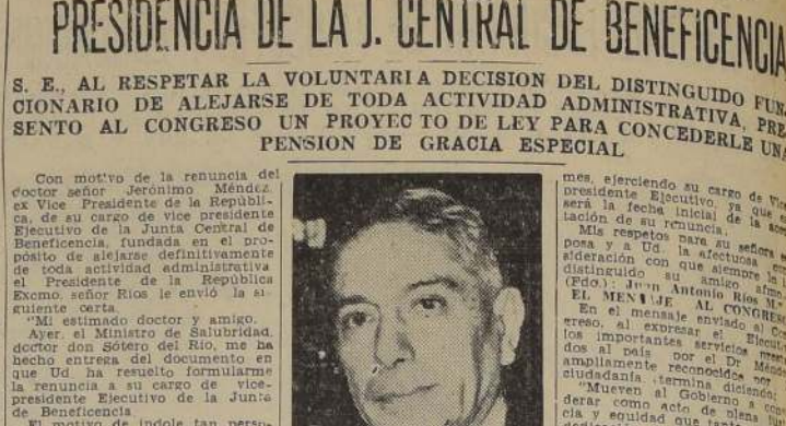
Mueven al Gobierno a comen- derar como acto de plena cía y equidad que tanto castro

ría mirar el alejamiento de cualquier servidor público por meritario y eficiente que éste fuera. En efecto, sus dilatados servicios al