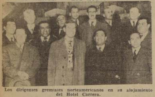
Los dirigentes gremiales norteamericanos en su alojamiento del Hotel Carrera.

REPRESENTAN A LA FEDERACION AMERICANA DEL TRABAJO, CONGRESO DE ORGANIZACIONES INDUSTRIALES Y HERMANDAD DE OBREROS FERROVIARIOS. — LOS ACTOS