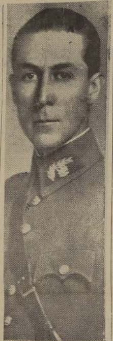
GENERAL CAÑAS MONTALVA

El General Cañas visitará el edificio "Pentágono" por segunda vez. Después se le observará con un almuerzo copioso y asistirá a una reunión de la Junta de Defensa norteamericana. Esa noche habrá otra recepción en el Cuartel General del Ejército.