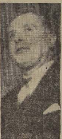
S. E. el Presidente de la República, cuyo discurso de hoy en Valparaíso es esperado con vivo interés en todos los círculos de ese puerto y de todo el país.

Pontífice llamó a un consistorio semipúblico, en el que los Obispos dieron su aprobación a las canonizaciones. La primera en ser canonizada, la francesa Bienaventurada Jeanne de Lesclapart, lo será el domingo próximo. La italiana María Giuseppe Rosello, fundadora de las Hijas de Nuestra Señora de la Merced, quien murió en 1880, será canonizada el 12 de junio. En el día de la Ascensión del Año Santo de 1950, serán canonizadas conjuntamente dos monjas italianas, Bartolomea Capitanini, quien fundó las Hermanas de la Caridad y murió en 1883, y la Bienaventurada Vicenta Gerosa. Terminará la serie de canonizaciones el domingo de Pentecostés de 1950, fecha en que se dará la canonización. Finalmente, el lunes 2 del presente, el Sumo