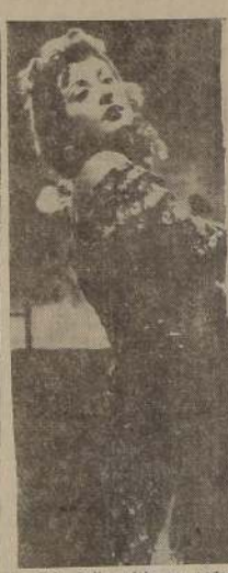
Maureen O'Hara en la sala del T. Victoria