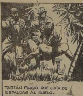
TARZAN FINGIÓ QUE CAÍA DE ESPALDAS AL SUELO.