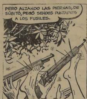
PERO ALZANDO LAS PIERNAS, DE SÚBITO, PEGÓ SÉNDOS PUNTAPES A LOS FUSILES.