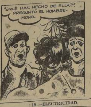
¿QUÉ HAN HECHO DE ELLA? PREGUNTO EL HOMBRE.