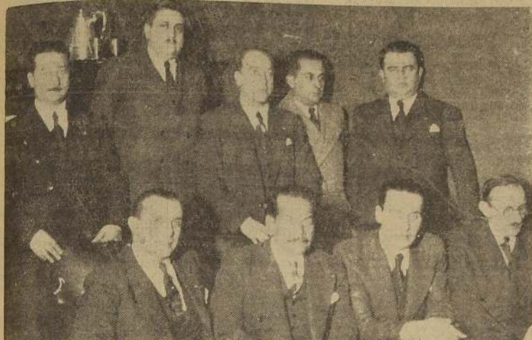
S. E. el Presidente de la República, rodeado de los miembros de la mesa directiva de la Convención Radical de la Serena durante la visita que le hicieron ayer