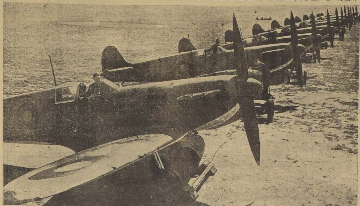
Escuadrilla de modernísimos aviones biplazas de combate Spitfire con que cuenta la Fuerza Aérea británica. Estas máquinas alcanzan velocidades de más de 600 kilómetros por hora.

Deportivas LA VUELTA CICLISTA DE FRANCIA PARIS, 11. (U. P.)—El francés Jean Fontenay pasó en la segunda etapa a la cabeza del lote de competidores que participan en la prueba ciclista Le Tour de France, pudiéndose presenciar el sorprendente desplazamiento del team belga después que los 70 ciclistas del lote habían traspasado los pasos alpinos y pirineos. La etapa de hoy fué dividida en dos partes, la primera de las cuales fué ganada por el belga Remondt, en una carrera individual contra Clock, entre Caen y Vire, sobre una distancia de 112 kilómetros, en 1 hora y 40 minutos. El francés Robert Tassin ganó la segunda de Vire a Rennes, sobre una distancia de 117 1/2 kilómetros, en 3 horas y 10 minutos. Fontenay remató segundo en Rennes, y se adjudicó la delantera por la regularidad de su carrera.