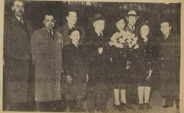
El violinista Mischa Elman a su llegada anoche a Santiago acompañado de su representante personal superior de la Empresa del Teatro Central.

Ayer llegó el violinista Mischa Elman, que viene a actuar dentro de la temporada de espectáculos musicales que este año ha presentado el teatro Central.