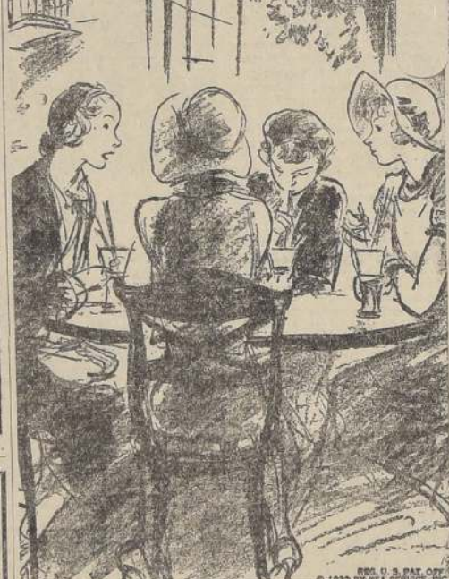
—¿Y qué es de Alicia? —¿No sabes? Después que sus padres se gastaron una fortuna preparándola para la ópera, ahora quiere casarse.