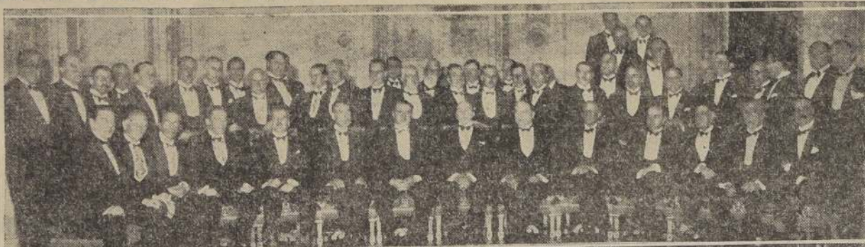
Asistentes al banquete ofrecido ayer en el Club de la Unión por los delegados de la Comisión Comercial peruana, que se encuentran en esta capital