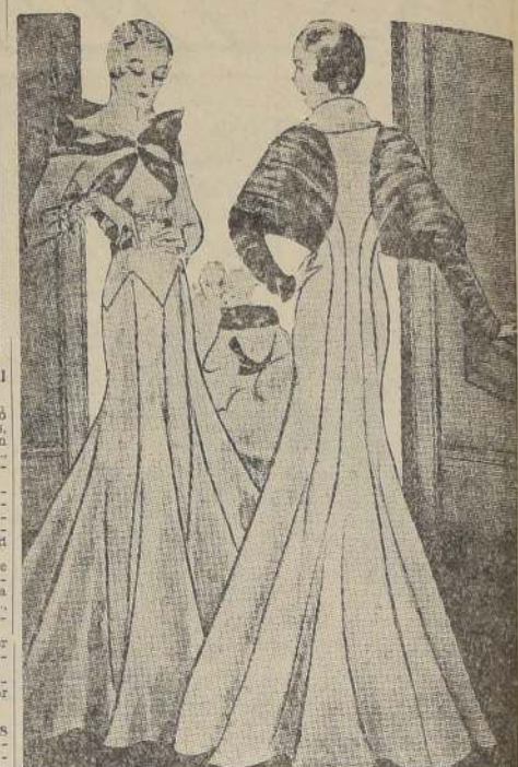
Estos dos originales vestidos de fiesta, creaciones de Henry Bendel, el modisto neoyorquino, son a la vez novedosos y elegantísimos. En ambos, Bendel ha empleado con suma habilidad los adornos de piel, para agregarles un nuevo encanto.

Estas conferencias constan de 3 partes, de 20 minutos exactas cada una, separadas por intervalos musicales de 10 minutos. Principiarán a las 11 de la mañana en punto, para terminar exactamente a las 12.14.