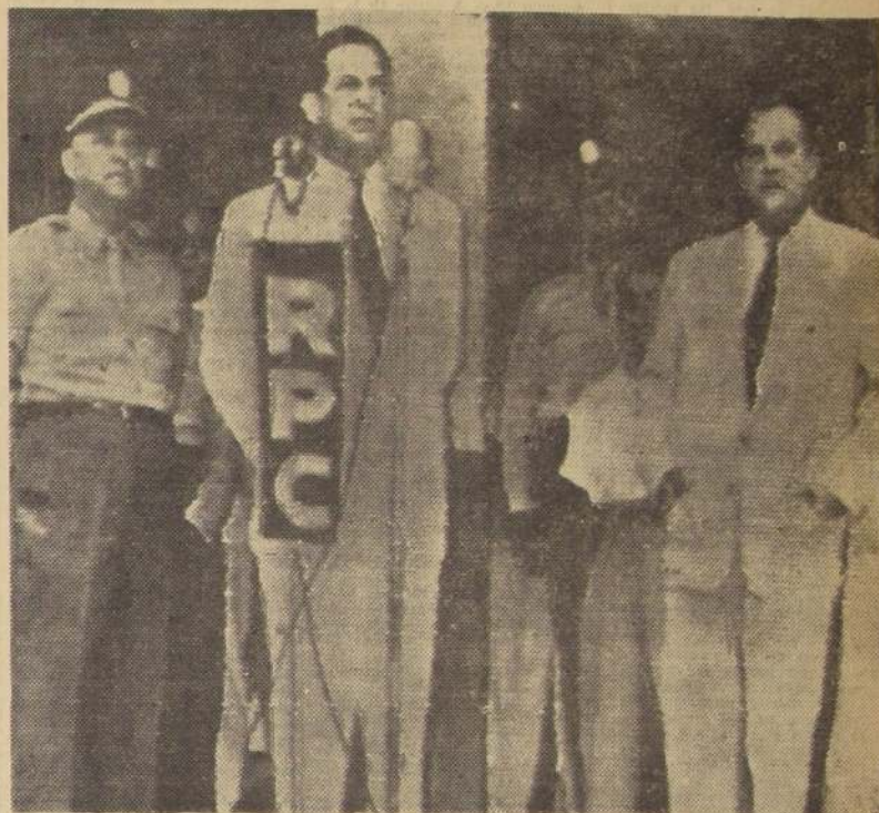
PANAMA.— El nuevo Presidente, Ricardo Arias espinoza (al centro), se dirige al pueblo panameño, después de ventados los últimos acontecimientos políticos que ensangrentaron este país. Ricardo Arias, que vivió muchos años en Chile, asumió la Presidencia, después que uno de los asesinos del Presidente Remón acusó de instigador de dicho asesinato al Vicepresidente, José Guizado. La Asamblea Nacional ordenó la prisión del acusado.

TEXTO DEL PROYECTO DE LEY: CONCUENADONAS DEL SENADO DE LA CAMARA DE DIPUTADOS. Ha sido propuesto permanente el S. Gobierno evitar el crecimiento exagerado de las plantas de personal de los diversos Servicios Públicos, procurando, además, ir a su reducción en forma que no produzca trastornos en las relaciones afectadas, ni en la disciplina del personal. En esta forma, las iniciativas que han sido en este orden de cosas, siendo la más importante, porque ya se encuentra convertida en ley, la que regula la contratación de personal, consultada el artículo 15 transitorio de la Ley N.º 11.575. vez remunerar en forma adecuada a sus funciones. Se consulta en el proyecto de ley, que se somete a vuestra consideración, el siguiente texto, en los términos a los propósitos que se han enunciado y que se comprenderán en toda su amplitud con la simple lectura de las disposiciones que componen el texto. SUPRESION CONSEJERIAS PARLAMENTARIAS. — Ha estimado necesario, además, y dentro de su tarea de normalización administrativa, la derogación de la Ley N.º 8,707, que creó las Consejerías Parlamentarias, institución que confirió al Parlamento el poder fiscalizador, lo ha privado de su función principal de su facultad consultativa, ya que