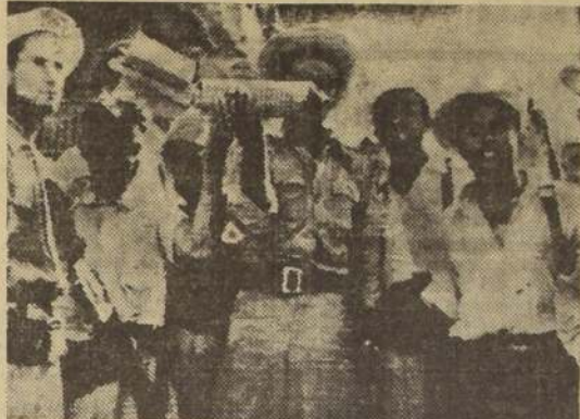
SANTA ROSA, Costa Rica. — Soldados rebeldes al Gobierno de José Figueres recogieron esta bomba lanzada por un avión rebelde, durante la "sangrienta" batalla de Santa Rosa, el sábado 15 de enero.

Fue cinematográfica la huida de chilenos de una cárcel mexicana CIUDAD DE MEXICO, 17. (A. L.). — Dos estafadores internacionales, de nacionalidad chilena, se escaparon de la penitenciaría local, empujados por unas fichas que los acreditaban como visitantes, y que los obtuvieron a viva fuerza de unos amigos que habían ido a verlos. En la celda que ocupaban los chilenos fueron encontrados dos individuos en completo estado de desnudez, completamente desahuciados, a quienes los asistentes les quitaron las ropas y las tarjetas para poder abandonar el presidio. Los desnudos quedaron detenidos junto con varios gendarmes de la prisión, a quienes se considera como implicados en el hecho. La policía anda ahora buscando febrilmente a los autores de la cinematográfica huida. Se cree que de no salir pronto de México, ambos delincuentes serán detenidos dentro de poco.