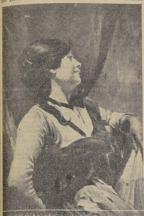
"Sevillana", óleo original de Alfredo Valenzuela Puelma

Una detenida visita a la interesante galería que contiene algunos dibujos y muchos cuadros pintados en Chile o por pintores chilenos en el extranjero.