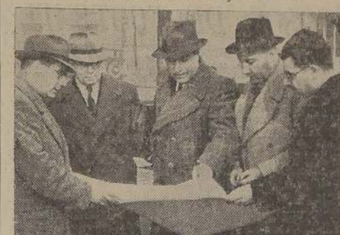
El senador señor Gustavo Giron y los regidores que lo acompañaron en su visita al barrio Independencia.

Se gestionará activamente la construcción de edificios para las Escuelas Dental y de Farmacia, un internado universitario y un Liceo