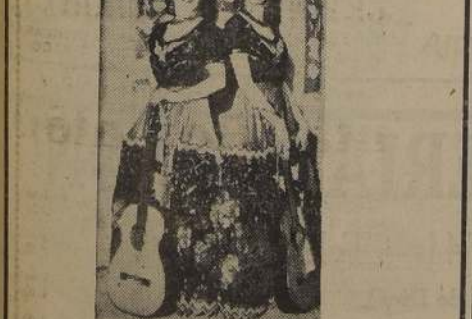
LAS DOS MARIAS.

RUBINOL OTORGA VIDA A SUS MEJILLAS. El Rubinol es mucho más fino que el rouge común. Su color vivo le encantará, y usted quedará gratamente impresionada de la forma cómo se adhiere al rostro durante todo el día. En polvo y compacto. Se venden en todas las farmacias, perfumerías y tiendas.