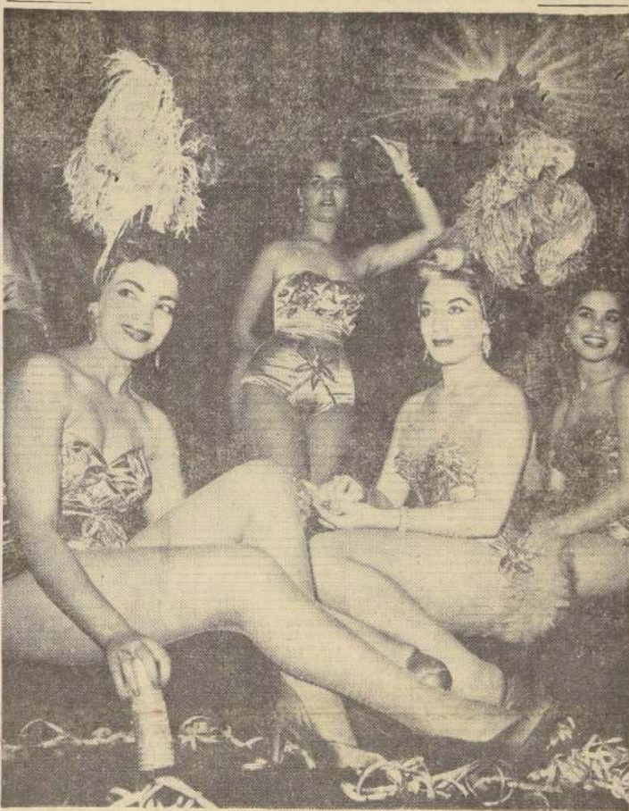
Durante la temporada de Carnaval, se realizan en el famoso Paseo del Prado en La Habana, los desfiles de carrozas en las cuales lucen toda su belleza las mujeres del Caribe. A lo largo del paseo toman colocación miles de personas para presenciar el desfile. En el grabado, gentileza de Pan American World Airways System, puede verse a un grupo de exponentes de la belleza de la mujer cubana durante estos desfiles de carnaval.