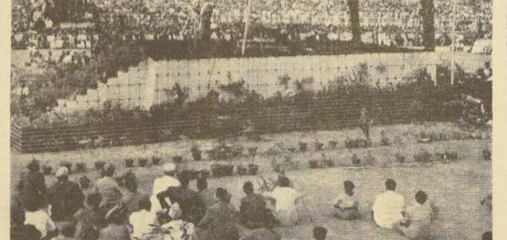
CORONACIÓN DEL NUEVO AGA KHAN EN KARACHI. — Ante una muchedumbre de 80.000 personas se fundó el príncipe Karim cuando se coronó en el Estadio Nacional de Karachi, como el 45.º Imam de los Ismaelitas. El grabado le muestra reversione de la técnica que llevó su abuelo el día de su jubileo de platino en Karachi, en 1952. El Aga Khan IV pronuncia un discurso después de la ceremonia de entronización.

CHILE A LAS NACIONES UNIDAS. — Chile declara la guerra al Japón y adhirió al Pacto de las Naciones Unidas.