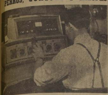
El control en plena función. Tiene en la mano un disco. Pronto lo colocará, le dará volumen o lo "ligará" con el control, para darle color y vida al episodio que se transmite.