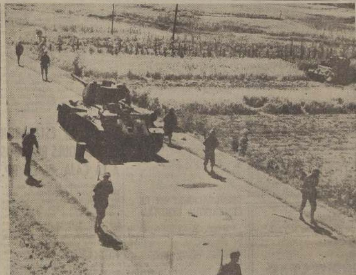
EN EL CAMINO HACIA SEUL. — Soldados de marina norteamericanos pasan por los costados de un tanque soviético incendiado, cuya tripulación vacía muerta en su interior. A la derecha, se ve también otro tanque de fabricación rusa inutilizado por los norteamericanos en sus ataques.

TOKIO, 25. (U. P.).— La radio comunista de Pyongyang anunció hoy el siguiente comunicado del Cuartel General: "Las tropas norteamericanas en la zona de Inchon han movido todo su poderío humano y de artillería, y tratan de romper las líneas de defensa de nuestras fuerzas. El 20 de septiembre, las unidades del Ejército del Pueblo, en la zona de Inchon, iniciaron un contraataque al enemigo, que resultó en un último asalto con apoyo de fuerza aérea y unidades de tanques. Como resultado de este contraataque, el enemigo sufrió enormes pérdidas y fue rechazado. Los soldados del Ejército del Pueblo que defendieron la zona de Inchon rechazaron los ataques del enemigo y continuaron sus operaciones de guerra. Las unidades del Ejército del Pueblo en la zona de la costa surcoreana están deteniendo al enemigo que avanza, y le han infligido considerables bajas".