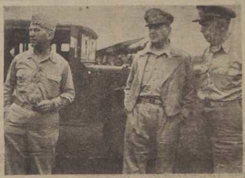
El General George C. Marshall, actual Secretario de Defensa de los Estados Unidos, aparece en esta fotografía acompañado del General Douglas Mac Arthur, Comandante en Jefe de las Fuerzas Aliadas en el Pacífico Sur, y el Teniente General Walter C. Krueger, Comandante del Sexto Ejército Norteamericano. Los tres se encontraban entonces en las oficinas de Mac Arthur, durante la Segunda Guerra Mundial.

TOKIO, martes 26 (UP).— URGENTE. — Un comunicado de las Naciones Unidas anuncia la caída de Seul. El comunicado es el siguiente: "Seul, capital de la República de Corea, está otra vez en las manos amigas de las fuerzas de la NU, incluyendo el Décimo séptimo regimiento del ejército de la República coreana y unidades de las divisiones Séptima del ejército de EE. UU. y Primera de la Infantería de Marina, que han completado el cerco y la toma de la ciudad". (A la página 11, columna 3).