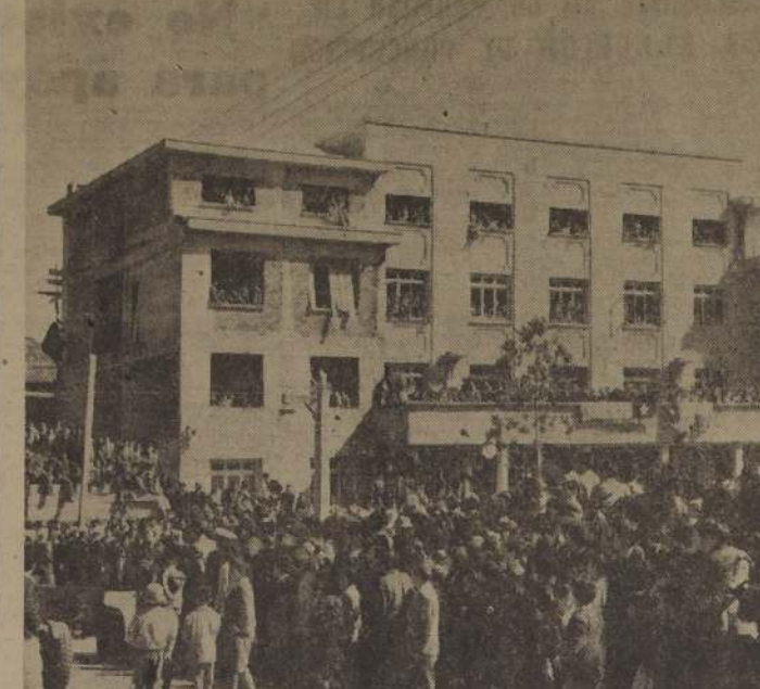
Desde hace varios años se encuentra inconcluso el edificio de la original, deben funcionar las principales oficinas gubernativas y también de los habitantes de Puerto Montt, que concurren a diario a ese edificio. (Foto de la Casa Regional, env.

Intendencia de Puerto Montt, donde, de acuerdo con el proyecto de la ciudad. Es imprescindible que esta obra sea terminada por nuestro corresponsal, Rolando Schmauk).