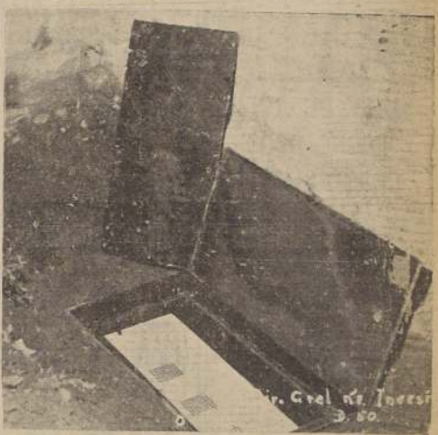
Sitio en que estaban enterrados los aparatos en el jardín de Kroll. Se ven las verdaderas proporciones que seguramente debe tener este caso único en los anales policíacos chilenos.