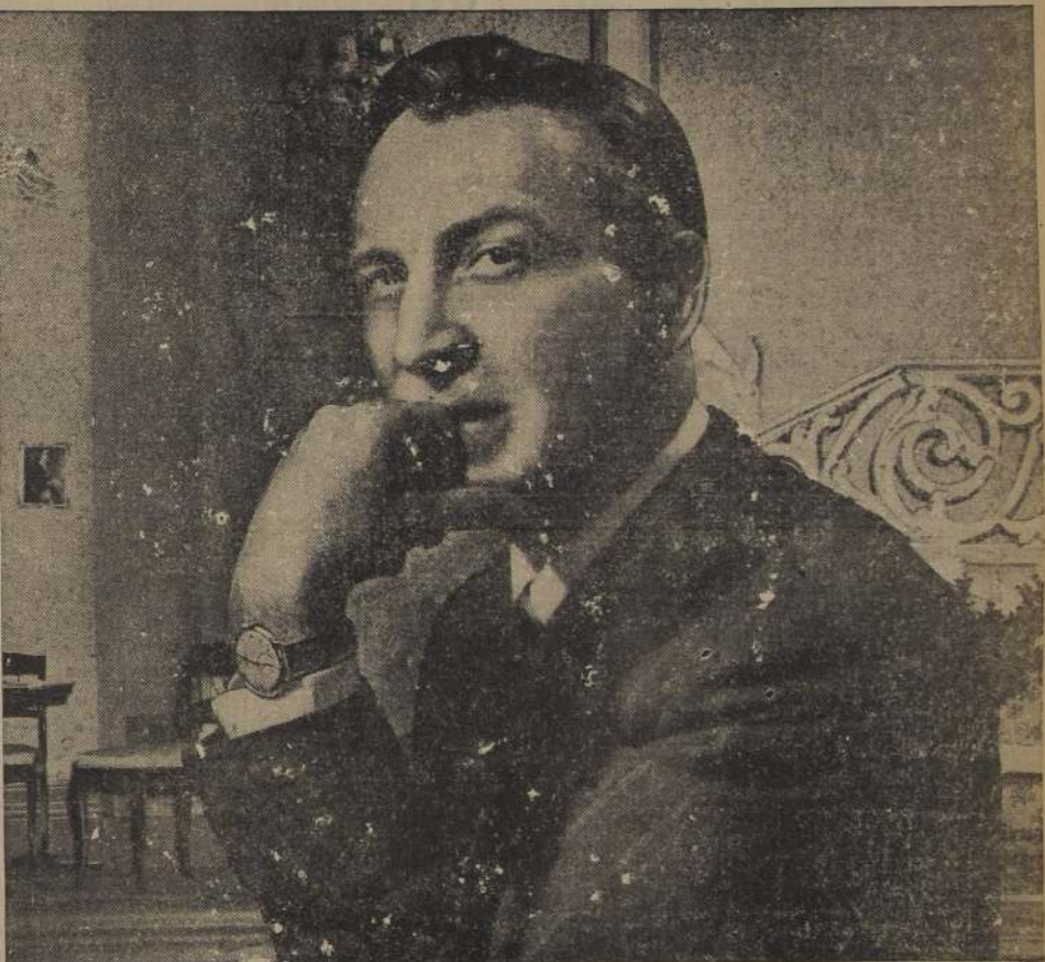
"Aun al cambiarme de vestuario para salir a escena, siempre conservo puesto mi finísimo Reloj Suizo, que seleccioné aconsejado por un relojero experto," dice ALEJANDRO FLORES, famoso actor chileno del cine y del teatro.