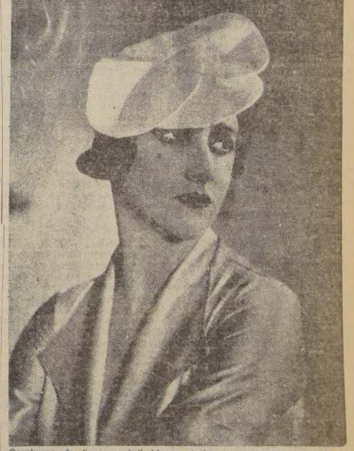
Sombrero de "gris-grain" blanco todo pespunteado. Modelo de Helene Sorbier, París