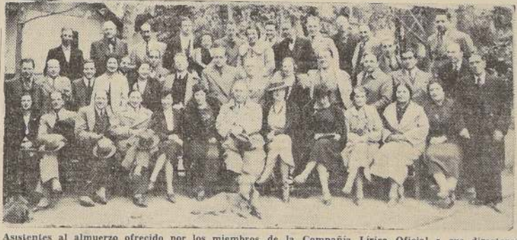
Asistentes al almuerzo ofrecido por los miembros de la Compañía Lírica Oficial a sus directores y miembros de la prensa