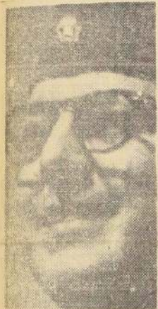
MARCOS PEREZ JIMENEZ