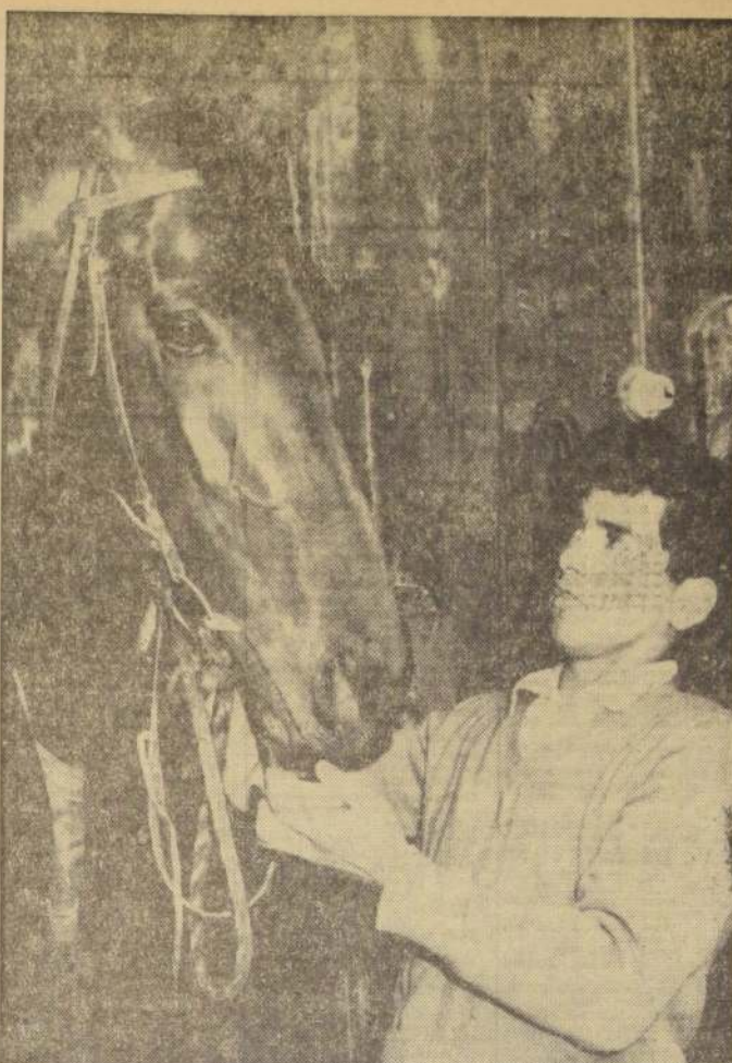
Cortesano será uno de los participantes en el Nacional "Ricardo Lyon", que se corre el domingo. El puma de Diego Salomayor tendrá la conducción de Sergio Vera.