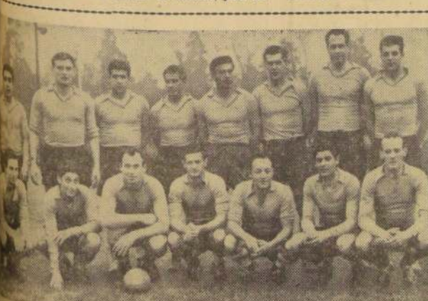
EN EL QUE HAY EXPERIENCIA. — El ensamble de jugadores ingleses y luxemburgueses, que se enfrentarán en el primer encuentro del campeonato mundial de fútbol internacional, en Wembley, el sábado 7 de octubre.