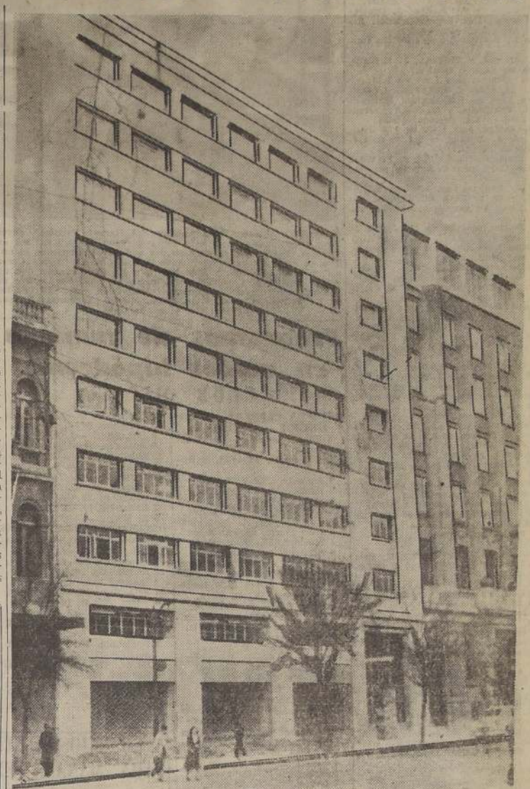
Aspecto del nuevo edificio que la Caja de Empleados Públicos y Periodistas está terminando en Alameda entre Teatinos y Amunátegui