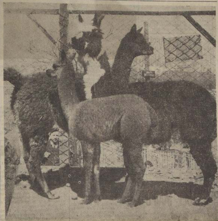
"Perilla" y "Bambi", los dos hermosos híbridos obtenidos con el cruzamiento de alpaca hembra y vicuña macho, nacidos en el Jardín Zoológico Nacional del Cerro San Cristóbal, junto a su madre "Doña Peña", se encuentran desde ayer en un stand especial en Quinta Normal, para participar desde hoy en la 79.a Exposición de Animales de la Sociedad Nacional de Agricultura. Junto a este grupo de animales híbridos, la Dirección del Zoológico presentará en esta oportunidad un trió de caracules y un trió de ovejas somales, con el objeto de dar a conocer los trabajos y experiencias que se están realizando en ese importante centro científico, como un nuevo aporte a la economía nacional, especialmente lo que se relaciona con nuevos tipos de lanas.