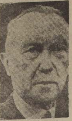
Konrad Adenauer, Primer Ministro de Alemania Occidental.