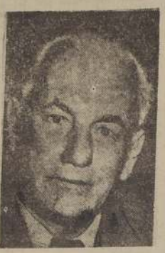
Wilhelm Pieck, dirigente comunista alemán que anunció la proclamación del nuevo Estado.