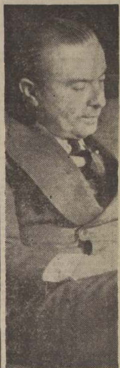
S. E. cuya política económica ha provocado una profunda sen- sación de confianza en EE. UU., que concedió ayer a Chile un crédito por 25 millones de dólares.