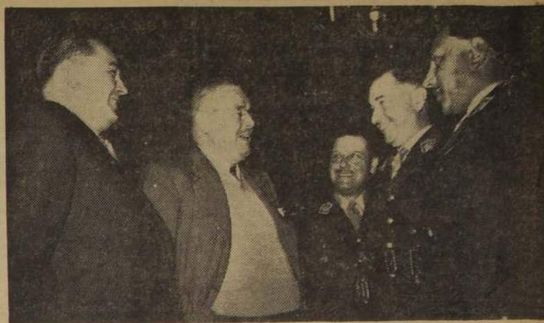
SE DESPIDEN DE S. E.— En la mañana de ayer se despidieron del Presidente los Generales y Jefes del Ejército argentino que asistieron a los actos conmemorativos de la Batalla de Malpú. El Jefe del Estado

Decreto N.º 1.370: Modifica el Reglamento General sobre Concesiones Marítimas, aprobado por decreto supremo N.º 1.239 de 1950.