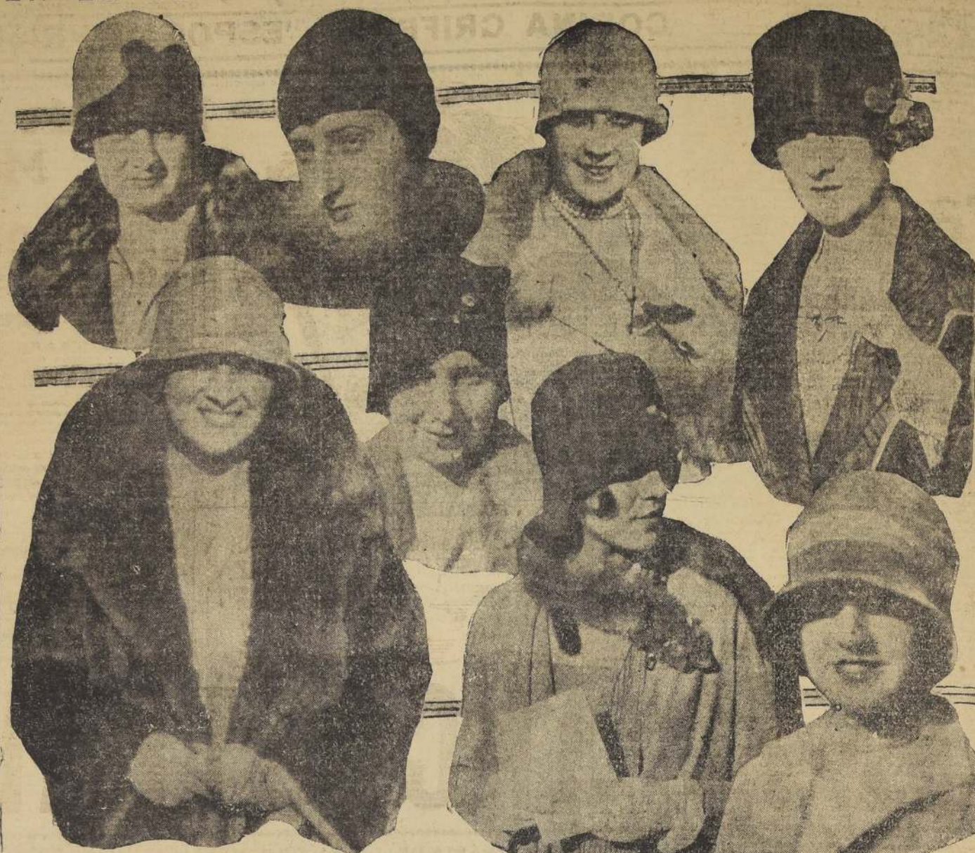
Algunas caras conocidas, anotadas en la tribuna de socios, durante la última reunión hipica

MATRIMONIOS. —Circulan las siguientes invitaciones: