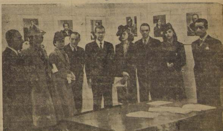
Algunos de los asistentes a la inauguración de la Exposición de Fotografías de Jorge Opazo, que se efectuó ayer en la Casa Muzard. Esta exposición alcanzó un merecido éxito y los asistentes elogiarán sin reservas las obras expuestas, que reafirman la condición artística, bien conocida, de Jorge Opazo.