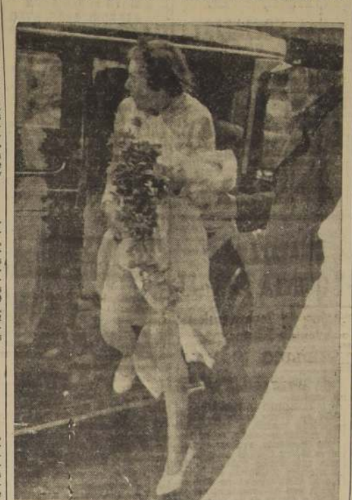
En Londres, una repentina corriente de aire sorprendió a esta novia en el momento de bajar de su automóvil y le levantó el vestido hasta más arriba de la liga.