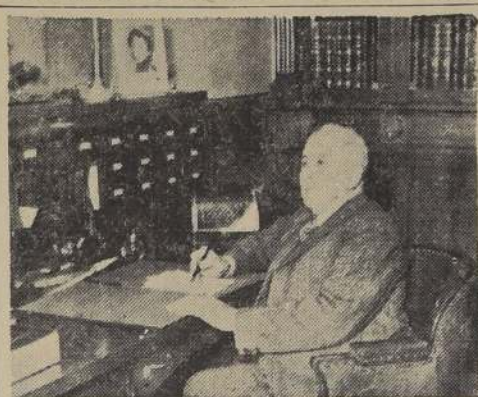
Don Luis Barros Borgoño en su escritorio

En su residencia de la calle Dieciocho, nos recibe don Luis Barros Borgoño, ex Embajador de Chile en Argentina, recientemente llegado al país, después de dos años y medio de ausencia. Encontramos al señor Barros Borgoño, en su despacho, rodeado de libros, diarios y revistas, sentado frente a su escritorio, en los momentos que redacta algunas notas. Saludamos al distinguido hombre público, quien nos ofrece asientos con voz amable y cordial. Al saber el motivo de nuestra visita, nos manifiesta que agradece la gentileza de LA NACION y que accede gustoso a responder a nuestras preguntas. La personalidad de nuestro entrevistado es sobradamente conocida en la política nacional: diplomático, historiador y hombre de letras, su figura es de relieve y llena toda una etapa de la vida del país. Puede decirse que la mayor parte de su existencia la ha consagrado a servir los altos intereses nacionales.