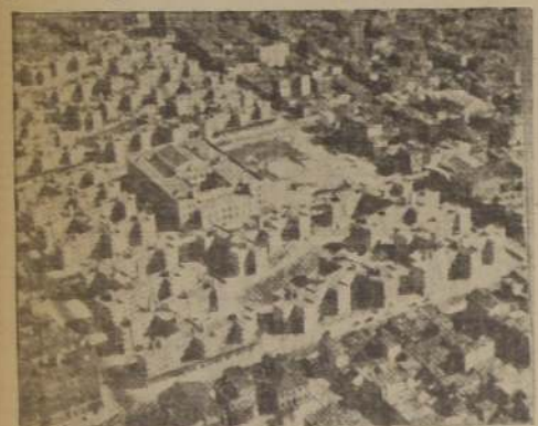
Aspecto de la ciudad colectiva de mañana, según un estudio descriptivo a ser exhibido en la Exposición Universal de Nueva York.

Edificación en serie será propiciada por la industria