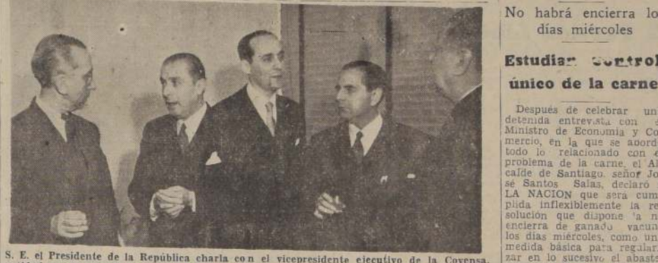
S. E. el Presidente de la República charla con el vicepresidente ejecutivo de la Covensa, entidad que le ofreció ayer una brillante manifestación por el éxito de su jira. Lo acompañan el Ministro de Hacienda y el Canciller