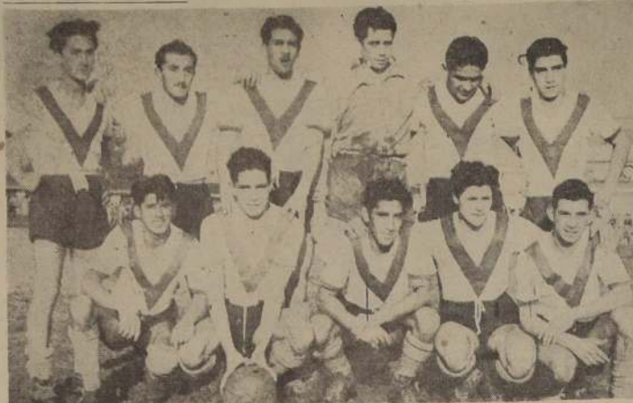
EL SANTIAGO. — En su último compromiso oficial empató a 3 goles con el Iberia, pudiendo ganar. Esta tarde los recoletos deberán enfrentar al Green Cross, en la cancha del Colo Colo, ex Estadio Carabineros

EN LAS CANCHAS que mencionamos, se jugarán hoy los siguientes encuentros que corresponden a la 7.ª fecha del campeonato oficial de las reservas de la División de Honor: