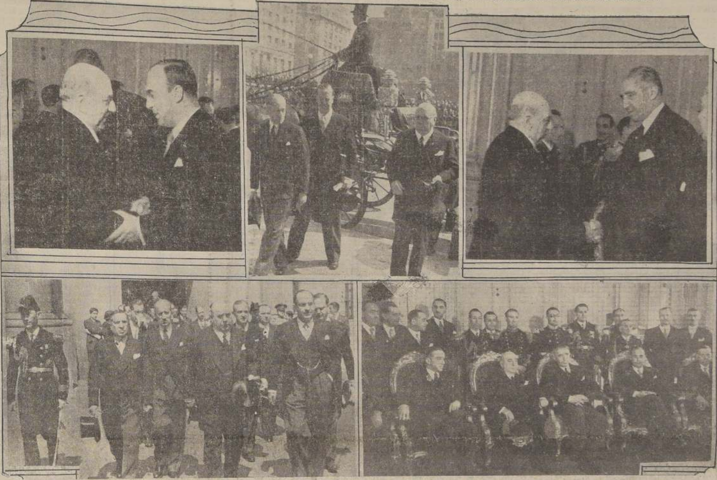
1.—Los Ministros de Relaciones Exteriores de Chile y Uruguay.—2.—El Excmo. señor Alberto Guani llegando a la Moneda.—3.—El Canciller uruguayo con el Excmo. señor Juan Antonio Ríos.—4.—El distinguido huésped y comitiva se retiran de la Moneda.—5.—Durante la visita que el Canciller uruguayo hizo ayer a S. E. el Presidente de la República

El Excmo. señor Ríos respondió al Canciller manifestándole el agrado con que recibía su visita a Chile y expresándole sus agradecimientos personales por la visita que el Canciller uruguayo, Excmo. señor Alberto Guani, por haber permitido que se verificara esta visita que le daba la oportunidad para conocer personalmente a S. E. el Presidente de la República. A continuación tomaron asiento, realizándose una charla, en la que participó el Ministro de Relaciones, señor Ernesto Barros Jarpa, y durante la cual se abordaron diversos tópicos de actualidad.