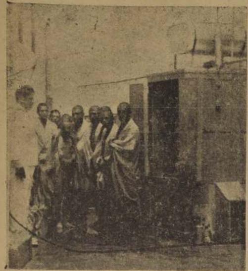
Una cámara higiénica

En las zonas sanitarias de Chile, esquina de Maule, en Antonio Varas N.º 50, en varios hospitales, en diversas reparticiones del Ministerio de Fomento y en numerosos hoteles del país, entre ellos, el primero de todos, el "Hotel Carrera", se han instalado últimamente las Cámaras Higiénicas "Labina", equipo sanitario que sirve para desinfectar la ropa, los colchones y que produce agua templada para baños en menos de 10 minutos, con un gasto de sólo veinte centavos de combustible por persona.