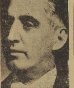
Excmo. señor don Juan Antonio Ríos

Sírvase aceptar las seguridades de mi personal deferencia y de mi más alta consideración. — (Fdo.) FRANKLIN D. ROOSEVELT."