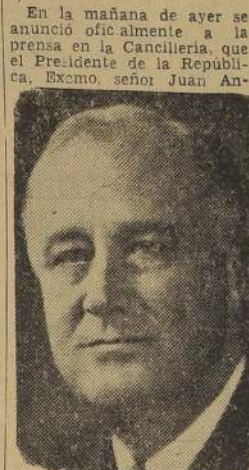
Excmo. señor Franklin Roosevelt

tonio Ríos, había resuelto aceptar la invitación del Presidente Roosevelt, para visitar en una fecha próxima Estados Unidos.