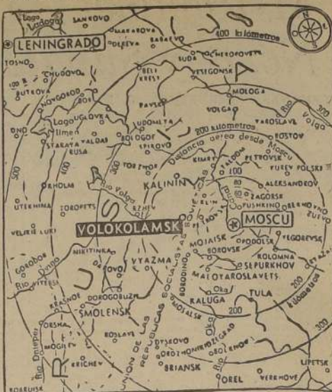
Esquema del frente norte de Rusia. En la región del lago Ilmen, las fuerzas soviéticas al mando de Timoshenko, han logrado uno de los éxitos más decisivos de la actual campaña de invierno