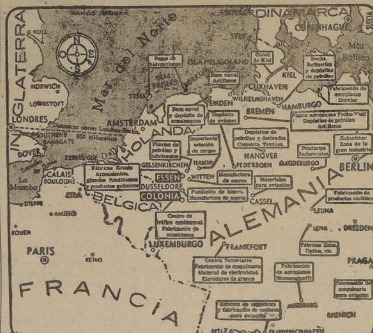
Objetivos de las fuerzas aéreas aliadas en el territorio del Reich

Entre tanto, simultáneamente con el ataque de Saint Nazaire, sobre las operaciones aéreas aliadas, se han formulado predicciones de que el año de guerra, con los iminentes ataques de "commandos" en gran escala en la zona del Atlántico ocupada por los alemanes, como parte preparatoria de la invasión general. Sin embargo, los observadores han advertido que el período de preparación puede demorar semanas, y aún meses, no días, a fin de completar todos los preliminares para el ataque final.