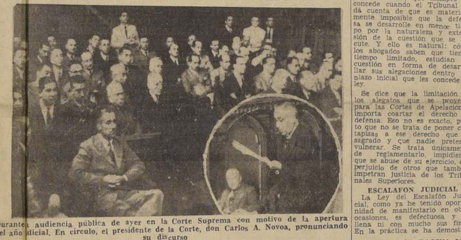
Durante audiencia pública de ayer en la Corte Suprema con motivo de la apertura del año judicial. En círculo, el presidente de la Corte, don Carlos A. Novoa, pronunciando su discurso

En la tarde de ayer, en una sesión ante que se efectuó en la Corte Suprema, quedó inaugurado el período judicial del presente año. A esta asistieron los Ministros de la Corte Suprema de Apelaciones, magistrados de los diversos juzgados de la capital, abogados y otras personalidades. En una audiencia pública, el Presidente de la Corte Suprema, don Carlos A. Novoa, pronunció un discurso en el que dijo: