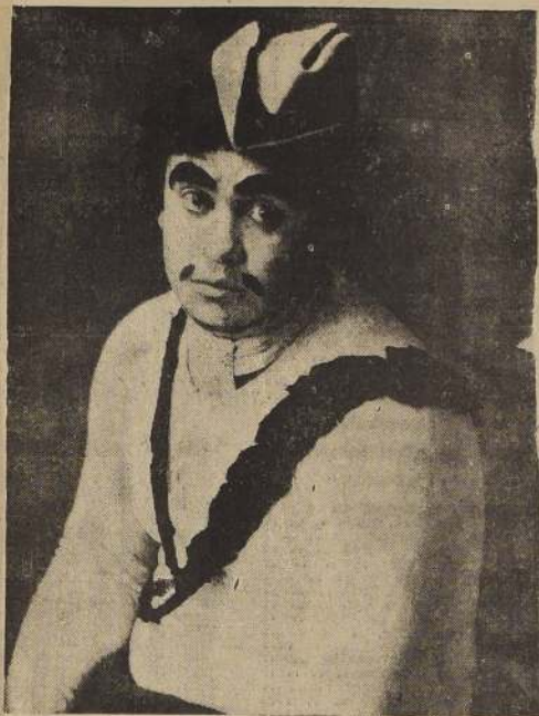
UN GRAN ESPECTACULO INTERNACIONAL CON CARMEN BROWN A LA CABEZA

El cine exhibirá LA VIDA DE CARLOS GARDEL, por Hugo del Carril, y El Terrible Sargento, una comedia por los Tres Chiflados