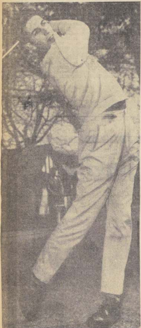
VAN DER VALK

DAMAS 1 P. de Fernández 83-82-82-76: 323 2 G. Gozálva 86-82-82-78: 328 3 C. de Phillips 82-82-85-81: 330 4 E. de Vermeiren 85-86-81-84: 336 5 T. de Siaren 82-85-82-89: 348 6 D. de Haritalde 82-85-82-89: 348