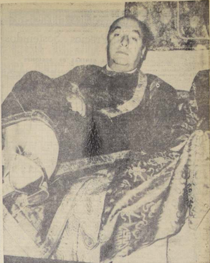
NERUDA PABLO: "Por amor sólo cantan las aves".