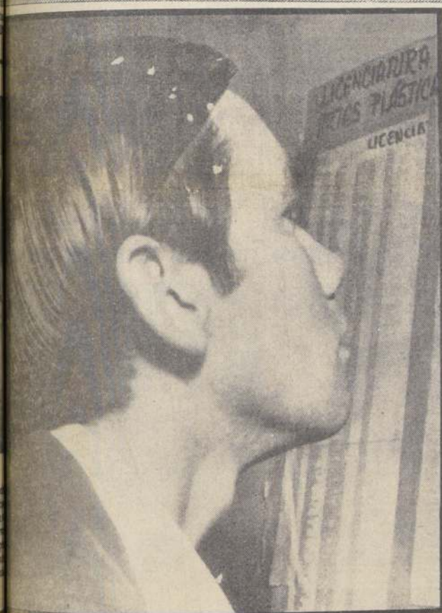
APTITUD ACADEMICA: El desencanto de no hallarse.