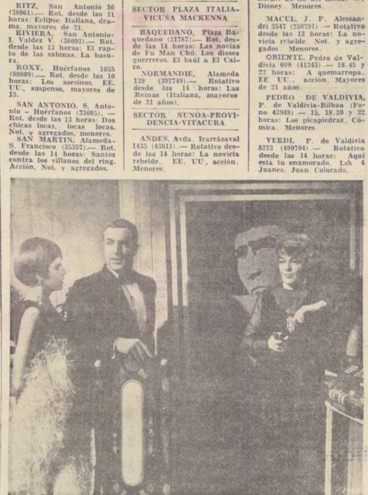
LOS TRES PARTICIPANTES EN LOS PELIGROSOS JUEGOS DE "LA MUERTE TOCA A LA PUERTA": Simone Signoret, Katherine Ross y James Caan.

SECTOR SAN PABLO - ALAMEDA - BRASIL - ESTACION ALAMEDA, Alameda 2987 (91254). — Rotativo desde las 11 horas: La virgen de Nuremberg. El dominador del desierto. El Oeste es una peste. ALCAZAR, Brasil 373 (80122). — Rotativo desde las 14 horas: A quemarropa. EE. UU., acción, may. de 21. A. ALESSANDRI, Alameda 2879 (96848). — Rotativo desde las 11 horas: Festival de cowboy: Revolver de un desconocido. BLANCO ENCALADA, Avda. Blanco, Encalada (91787). — Rotativo desde las 14 horas: Los valientes mueren de pie. El aventurero de Montecarlo. El medallón de Pekin. CARRERA, Alameda 2151 (86653). — Rotativo desde las 14 horas: El rapto de las vírgenes. Miguel Strogoff. El último de los mohicanos. COLON, San Pablo-San Martín (733146). — Rotativo desde las 14 horas: Los piratas del Rey. Amargo retorno. El bandido negro.