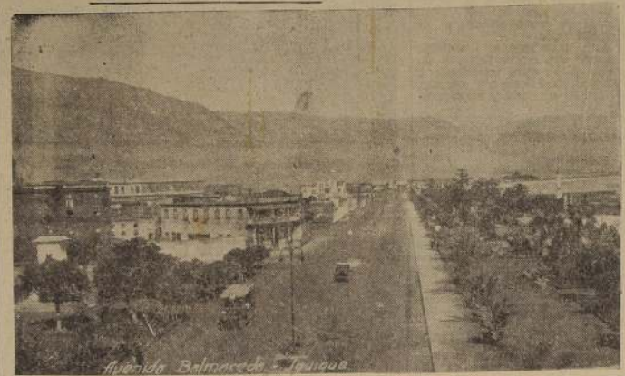
Playa de Balmaceda, Tarapacá

El más importante de todos ellos es el de Pintados, por su elevada ley en cloruros.