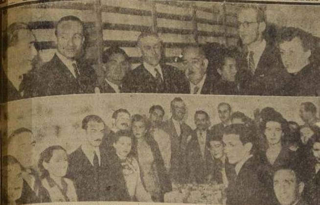
La delegación de fútbol de la Universidad de Chile, en el local del Instituto de Educación Física, en la tarde de ayer, en honor de las delegaciones atléticas que to-