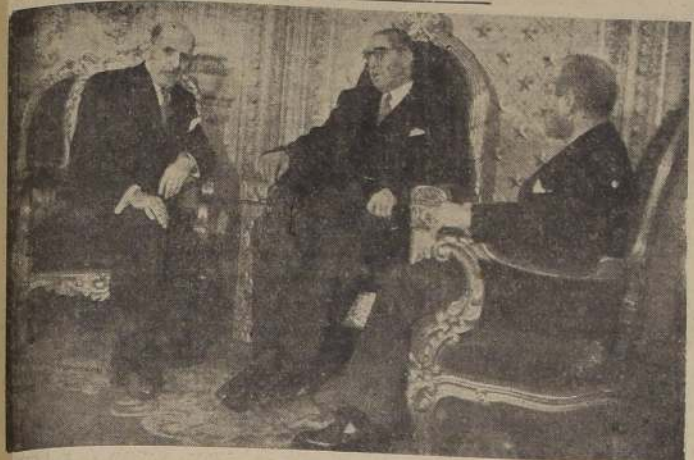
S. E. y el Cancellier durante la ceremonia de presentación de credenciales del Embajador de Panamá

LE RINDIERON HONORES MILITARES CORRESPONDIENTES A SU ALTO RANGO, TROPAS DEL REGIMIENTO TREN Y DE LA GUAR DIA DE PALACIO