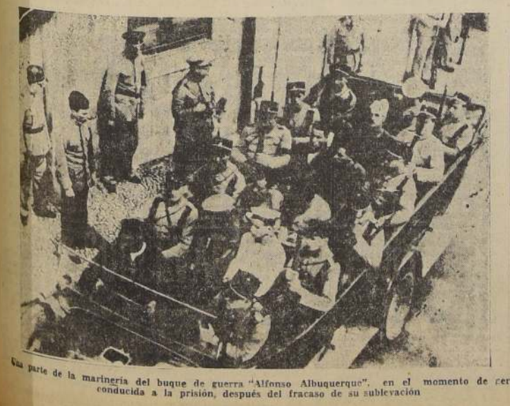
Una parte de la marinería del buque de guerra "Alfonso Albuquerque", en el momento de ser conducida a la prisión, después del fracaso de su sublevación.