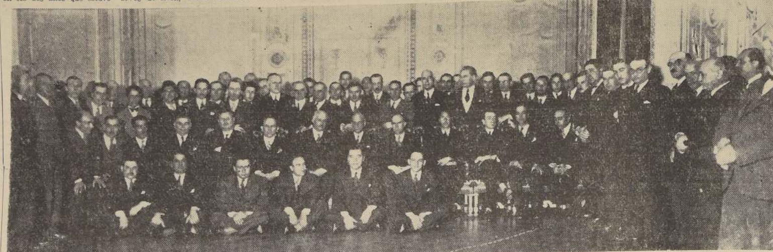
Asistentes a la manifestación de ayer en honor del Ministro del Interior, don Matías Silva, en el Club de la Unión

A mediodía de ayer se efectuó el banquete con que el personal de las oficinas del Ministerio de Fomento y de todas las reparticiones dependientes de este organismo, ofrecieron al Ministro del Interior don Matías Silva, como exteriorización del afecto que se supo captar entre sus colaboradores y subalternos, en los dos años que estuvo al frente de esa repartición. El banquete, que se efectuó en el Club de la Unión, fue muy animado y se prolongó hasta las 10 horas de la noche. En él participaron, además del Ministro del Interior, don Matías Silva, el Ministro de Fomento, don Teodoro Schmidt, y todo el personal dependiente de este Ministerio.