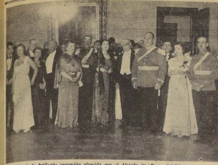
Doa aspectos de la brillante recepción ofrecida por el Alcalde de Valparaíso en la Municipalidad de ese puerto. En el primero de ellos aparecen el Director General de la Armada, vicealmirante

Ha fallecido esta distinguida y bondadosa dama descendiente de ilustres patricios de la República y emparentada a familias de la Argentina.