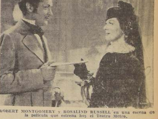
ROBERT MONTGOMERY y ROSALIND RUSSELL en una escena de la película que estrena hoy el Teatro Metro.

Hay expectación por ver esta obra, no sólo por ser la primera que la autora escribe, sino también por tratarse de un tema tan complicado, y que representa el más difícil de los problemas sociales de todos los países y de todos los tiempos.