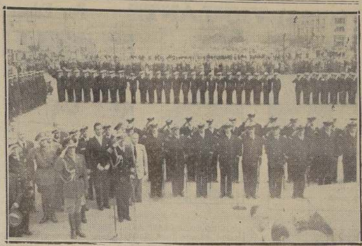
Los oficiales y cadetes argentinos formados frente al monumento a don Bernardo O'Higgins, durante la ceremonia de ayer.