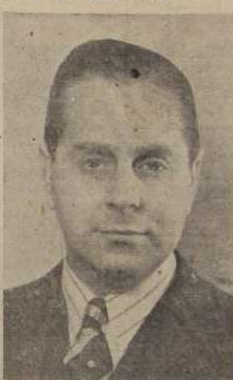
Ministro de Hacienda, señor Germán Pico Cañas.

La segunda medida será la de economizar divisas en la adquisición de carne en el extranjero. Para esto se impondrá al país la obligación de prescindir del consumo de carne importada dos días a la semana, para reemplazarla por cordero de Magallanes o pescado.