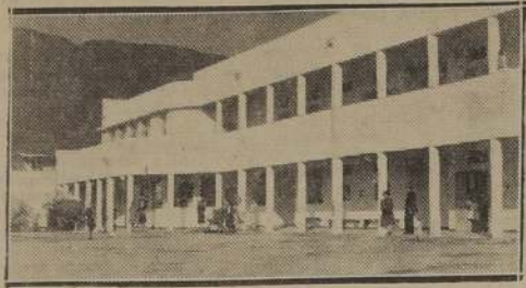
Moderna Escuela de Artesanos que inaugurará el Ministro de Educación

Nos manifestó dicho Secretario de Estado, que por encargo especial de S. E. los Ministros que efectuarán esta rápida jira, informarán a las autoridades y en general al pueblo de las principales necesidades educativas del norte, para tratar en el terreno mismo de darles solución inmediata, y a la vez dar a conocer sus propósitos de nuevas orientaciones a la enseñanza técnica y vocacional.