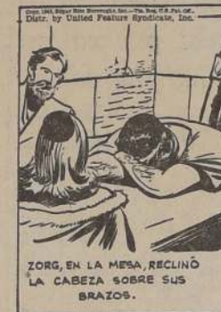
ZORG, EN LA MESA, RECLINO LA CABEZA SOBRE SUS BRAZOS.