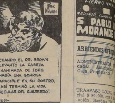
CUANDO EL DR. BROWN LEVANTÓ LA CABEZA INANIMADA DE ZORG HABÍA UNA SONRISA APACIBLE EN SU ROSTRO. ¡ASÍ TERMINÓ LA VIDA SECULAR DEL GUERRERO!

BRILLANTES, JOYAS, boletos, vendo y compo- rrumpieron en el cuarto, vieron un extraño espectáculo.