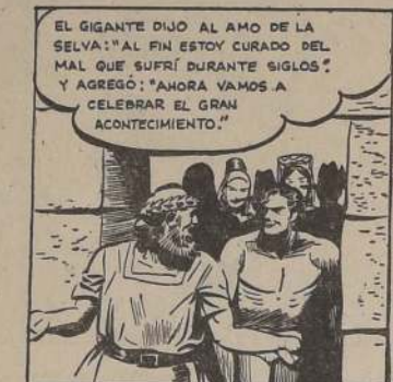
EL GIGANTE DIJO AL AMO DE LA SELVA: "AL FIN ESTOY CURADO DEL MAL QUE SUFRÍ DURANTE SIGLOS." Y AGREGÓ: "AHORA VAMOS A CELEBRAR EL GRAN ACONTECIMIENTO."