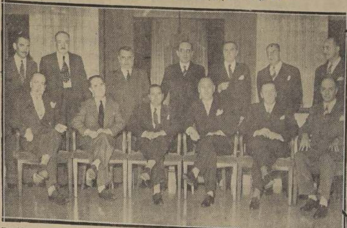
Comida ofrecida por el Directorio de Manufacturas de Cobre S. A. Madeco, en honor de los Ministros de Hacienda y Economía, señores Germán Pico Cañas y Luis Bossay, con motivo de haberse incorporado como directores de esa sociedad.