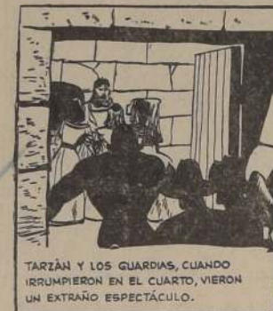
TARZAN Y LOS GUARDIAS, CUANDO IRRUMPIERON EN EL CUARTO, VIERON UN EXTRAÑO ESPECTACULO.