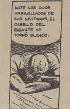
ANTE LOS OJOS MARAVILLADOS DE SUS INVITADOS, EL CABELLO DEL GIGANTE SE TORNO BLANCO.