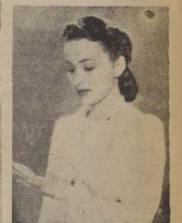
Olivia de Havilland

Los agentes del Gobierno están investigando la causa del incidente, el cual, según los policías heridos traídos a esta ciudad, se produjo cuando asaltaron la municipalidad unos 50 hombres armados de granadas de fabricación casera, escopetas y revólveres. Se produjo un tiroteo, y dos de los policías que vigilaban la municipalidad perdieron la vida. Otras dos muertes se debieron a una pelea por motivos personales.