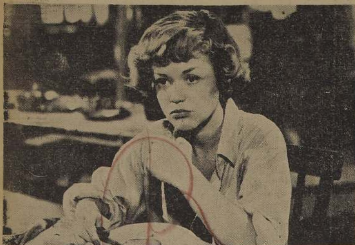
Simone Simon en una escena de "Mujeres con pasado", film de "Grandes Películas" que estrena hoy el Bandera.