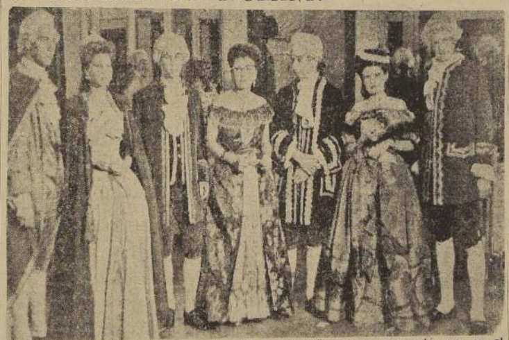
Algunos de los intérpretes de "La evocación de Mozart", que se representó ayer en el Teatro Municipal, a beneficio del Servicio Social de la Universidad "Juan Enrique Concha".