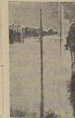
Los aspectos de la inundación en el barrio Puchacay de Concepción, en los momentos que algunos vecinos son salvados en canchales.

El Bío Bío aisló numerosos vecinos de Santo Domingo