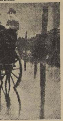
Los aspectos de la inundación en el barrio Puchacay de Concepción, en los momentos que algunos vecinos son salvados en canchales.

Por otra parte el carabinero Yáñez fue sancionado por el conflicto. — (Colina, corresponsal.)