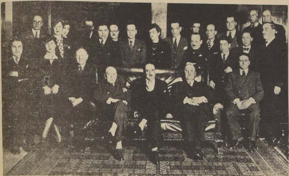
El presidente del Consejo de "La Nación", acompañado del Director, del Gerente, Subdirector, jefes de las distintas secciones y un grupo del personal.