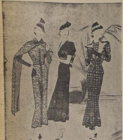
Los dos modelos de la izquierda pertenecen a Jean Patou, y el de la derecha a Robert Piguet.