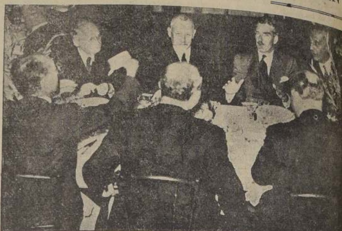
Un grupo de delegados de los países europeos a la Conferencia contra la piratería en el Mar del Norte, discuten sus importantes temas mientras esperan el almuerzo. De cara a la cámara pueden verse a Máximo Litvinof, al doctor Schranz y a Anthony Eden.