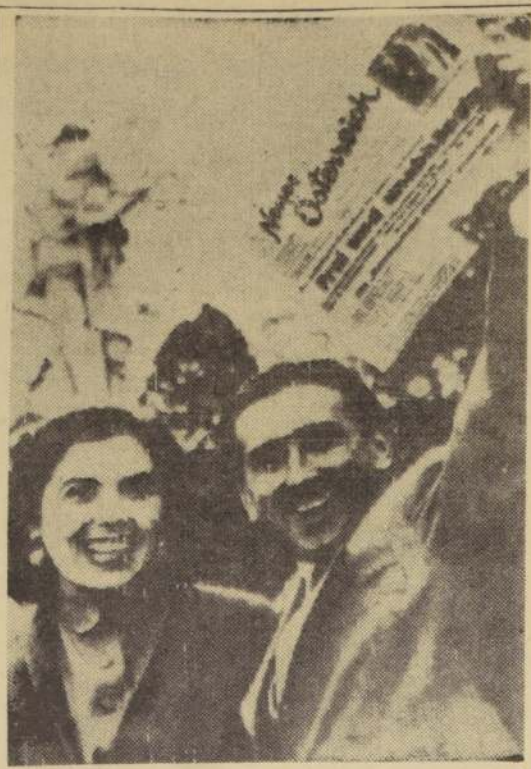
VIENA. — Una feliz pareja austriaca se une al regocijo general en los momentos de anunciarse la firma del tratado de paz de Austria. Los Ministros de Relaciones Exteriores de Gran Bretaña, Francia y Rusia, y el Secretario de Estado de USA, junto con el Canciller austriaco, Leopold Figl, pusieron sus firmas en los documentos que aseguran a Austria su completa independencia por primera vez en 17 años. (En los titulares del diario se lee: "Libre e Independiente").