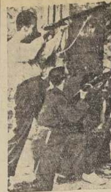
Soldados disparando contra el Alcazar de Toledo

MATERIAL DE GUERRA NORUEGO GIBRALTAR 10.—(U. P.) —Se ha sabido que el crucero "Libertad", que es leal al Gobierno español, estuvo frente a Melilla, el lunes, a un vapor noruego, y le solicitó un examen de los papeles. El capitán del barco noruego que llevaba carga general para el Pireo; pero al hacerse una revisión, le fue encontrado un abundante material de guerra, el cual se supone iba a ser descargado en Melilla. Se le ordenó al vapor dirigirse a Cartagena, siendo escoltado por el crucero "Libertad".