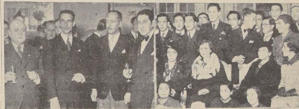
Los aspectos de la recepción de ayer en la Legación del Ecuador