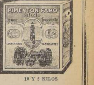
10 Y 5 KILOS

ESTADO 91 CASILLA 3666 S.O. Vera & Co. S.A. SANTIAGO