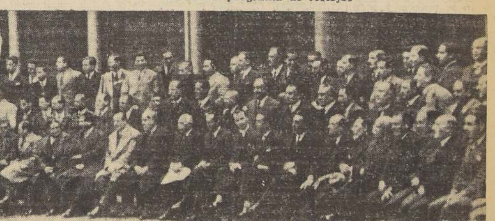
— de los asistentes al almuerzo que ayer en el Instituto Nacional