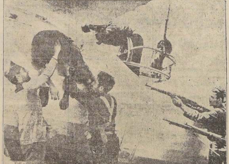
Un piloto revolucionario herido es retirado por soldados del Gobierno de su avión, derribado en Somosierra