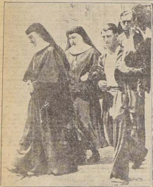
Rebelde de Madrid abandonando su convento, escoltado por miembros de la milicia del Gobierno, al ser requisado el edificio para las necesidades del ejército.

Se está preparando la ofensiva general contra Madrid con todas sus fuerzas