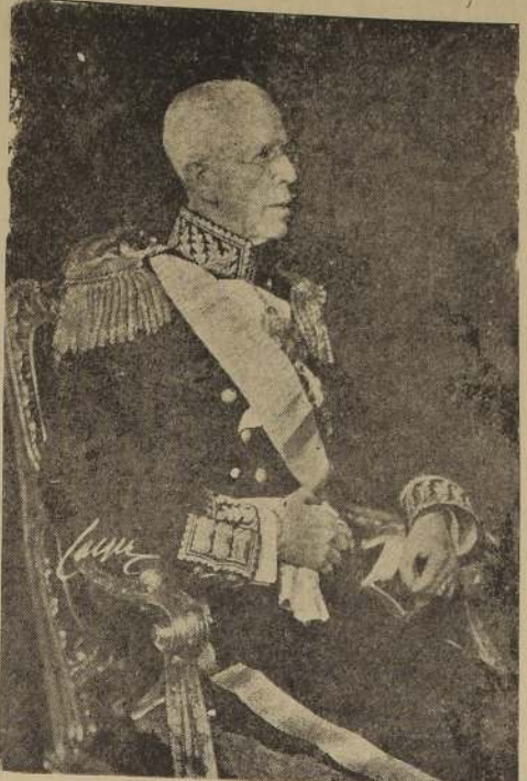
S. M. el Rey Gustavo V de Suecia que hoy cumple 86 años de edad.