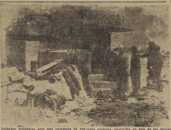
Soldados británicos ante una casamata de concreto alemana, destruida en una de las playas de Normandía.