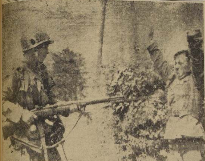
Un paracaidista norteamericano captura a un soldado alemán en Francia durante la embestida de los aliados contra los nazis en el continente — (Radio Telefoto transmitida a N. York).

En esta incursión participaron super-fortalezas volantes con base en China