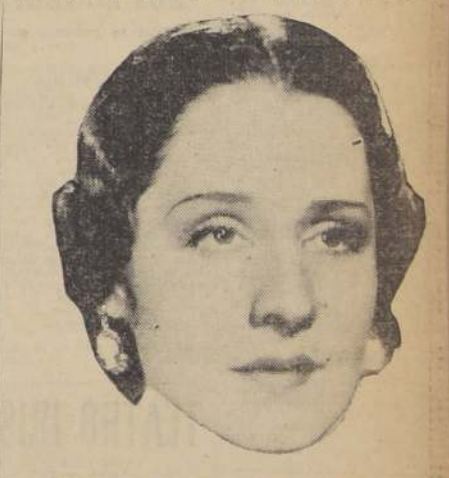
NORMA SHEARER, Metro Goldwyn Mayer

Desde hace veinticinco años se viene comprobando que la cera pura mercolizada constituye el mejor embeleccador del cutis, merced a lo que, merced a ella, puede confiarse por sus seguros resultados. Su uso resulta económico. Cera mercolizada no hace recibir un cutis seco, opaco y muerto, al que hace desprender la cutícula exterior, gastada, revelando la sana y natural belleza que se encuentra inmediatamente debajo. Un tratamiento de diez días operará un cambio maravilloso en su rostro, rejuveneciéndolo. Deje que la cera mercolizada le proporcione un cutis nuevo, suave aterciopelado. Aplíquela también a sus manos y brazos: los conservará suaves, blancos y hermosos.