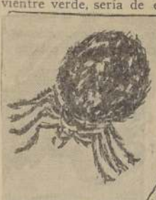
El objeto de este estudio científico es la araña peluda, de vientre verde, que picó a la niña.

El programa de esta noche es el mismo que el de la noche anterior. El programa de esta noche es el mismo que el de la noche anterior.