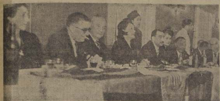
Grupo de asistentes a la manifestación que se efectuó en los Salones de "ORIENTE" con motivo de la inauguración de la Clínica Catalana