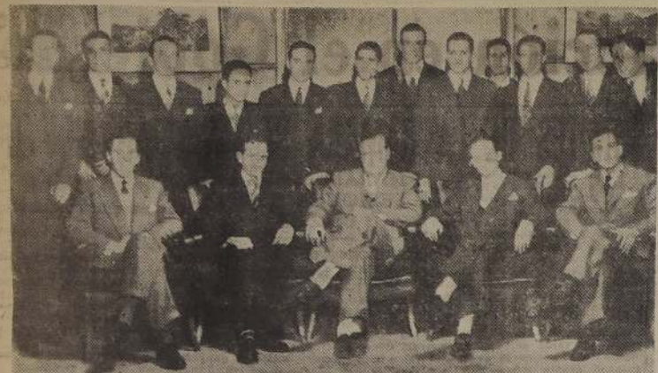
Los alumnos egresados del sexto año de humanidades del Colegio de San Ignacio, se reunieron en un almuerzo de camaradería en el Salón Inglés del Hotel Carrera.

PRIMER CONCIERTO DE BERNARD MICHELIN. — Mañana en la noche ofrecerá su primer concierto en el Teatro Municipal el célebre violonchelista francés Bernard Michelin, artista de gran reputación entre nosotros y consagrado como el justo sucesor de Pablo Casals.