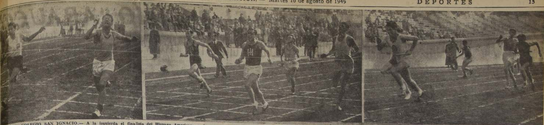
GANÓ EL COLEGIO SAN IGNACIO. — A la izquierda el finalista del Hispano Americano se impone sobre el de San Agustín en la primera serie de la posta de 8 por 50 metros; al centro, Castillo, del Instituto de Humanidades, gana la 4.ª serie de los 100 metros, superior y, a la derecha, un aspecto del desarrollo de la segunda serie de la posta de 8 por 50 metros, que se adjudicó el Liceo Alemán. — El torneo se lo adjudicó el Colegio San Ignacio