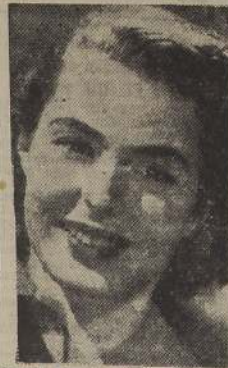
Ingrid Bergman, cuyo discutido romance con Rossellini ha coincidido con la filmación de la película "Stromboli", para el sello RKO Radio.