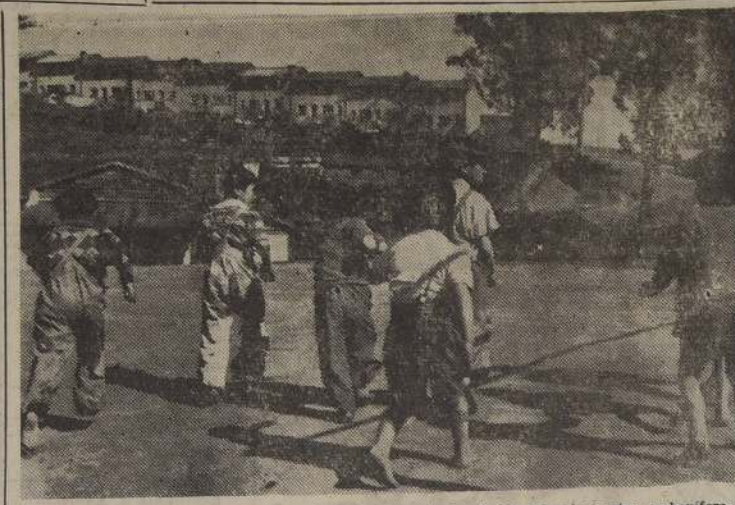
Niños de una población obrera de Lota juegan en una tarde de sol. En este centro carbonífero se construirán 104 nuevas casas para trabajadores, con un costo de cinco millones de pesos.