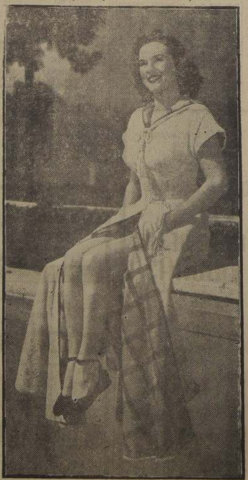
DEANNA DURBIN se presentará próximamente en Broadway, interpretando el rol principal de una obra de Schubert, "Molly X" (La historia de Molly X), cuando Warner Bros. reclamarán sus servicios primitivamente un ofrecimiento para actuar en "Story of Molly X".

(Redactor de Cine de la United Press) (Especial para "LA NACION")