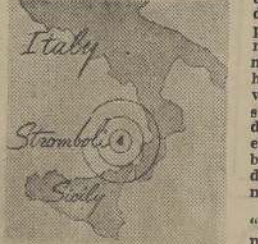
La isla de Stromboli se encuentra situada entre Sicilia y el sur de Italia.