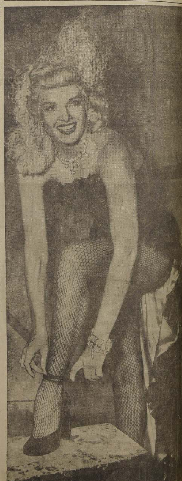
La presencia de Jane Russell asombró a todos los asistentes a una fiesta de cine, y sinceramente la cosa no era para menos. Apesar de haber aparecido en pocas películas, Jane es una de las actrices más populares del cine, gracias a una activa campaña publicitaria.

Sonrientes y felices bajo el dorado sol del sur de Italia, Ingrid Bergman y Rossellini descansan un momento de sus pesadas labores en el cine, sentados frente al famoso volcán Stromboli.