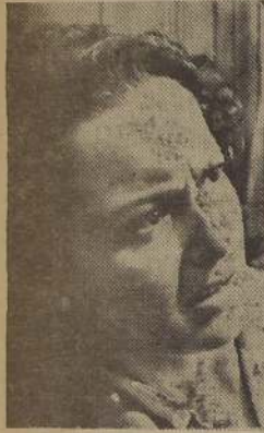
OLIVIA DE HAVILLAND

FIJARAN LA FECHA DEL ESTRENO DE UNA CINTA PARA EL ELEGANTE REX