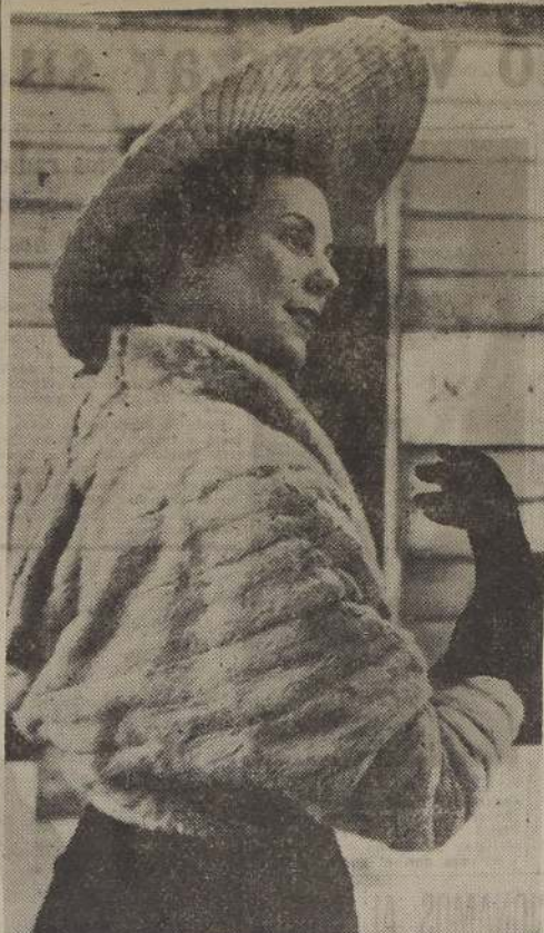
Elegante bolero de herminia beige, con movimiento de drapado en las espaldas. — Modelo de Jacques HEIM.