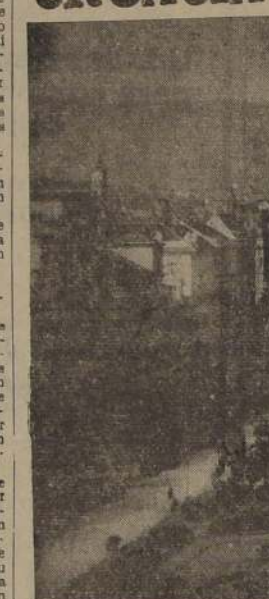
La plaza Jelacic, en Zagreb

EL JEFE DE LA GESTAPO DE CROACIA FUE MUERTO EN ZAGREB