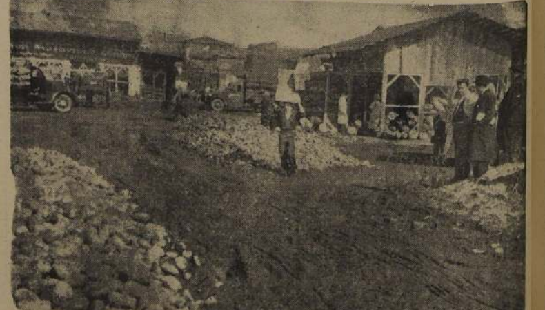
Pavimentación paralizada que obliga a los comerciantes a trabajar en pésimas condiciones