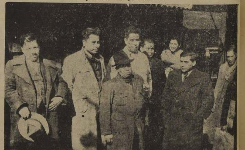
Dirigentes de los Sindicatos de la Feria Municipal

Así juzgan los comerciantes de la Feria el proyecto de habilitar un galpón para las ventas de productos.— Irian nuevos intermediarios, pero no los productores