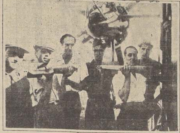
Barcelona. — Voluntarios cargando bombas en un avión destinado a combatir a los rebeldes de Zaragoza.

La rendición de Córdoba es inminente. Esta ciudad es bombardeada continuamente por la artillería de la aviación.