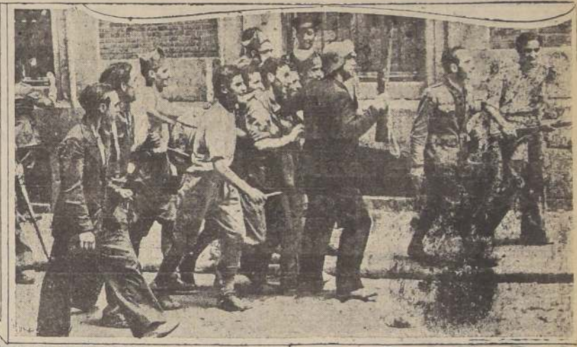
Madrid. — Un oficial rebelde capturado por tropas leales es conducido por las calles de Madrid.