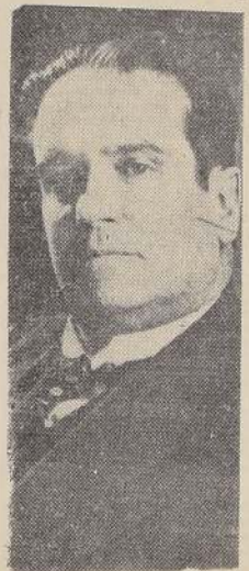
Don Hernando Siles, Ministro de Bolivia en Chile

Exito prometen alcanzar los números del programa confeccionado.— El Te-Deum de ayer.— Los actos que se desarrollarán mañana