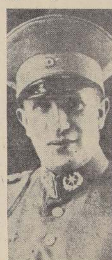
General don David Toro, Presidente de Bolivia

Entre las reuniones preparadas por los bolivianos de esta capital, debemos mencionar el cocktail cantant, que se llevará a efecto hoy, a las 18 horas, en Huérfanos.