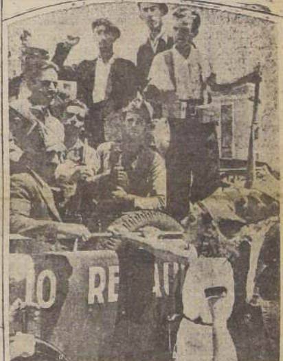
Madrid. — Voluntarios armados por el Gobierno se dirigen a Guadarrama. En primer plano se ve a una de las muchas mujeres enroladas que recibieron armas para luchar en los distintos frentes.