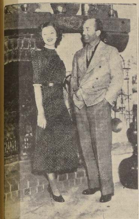
Myrna Loy, estrella de la Metro Goldwyn Mayer, y su esposo Arthur Hornblow, hijo, poco después de su matrimonio.