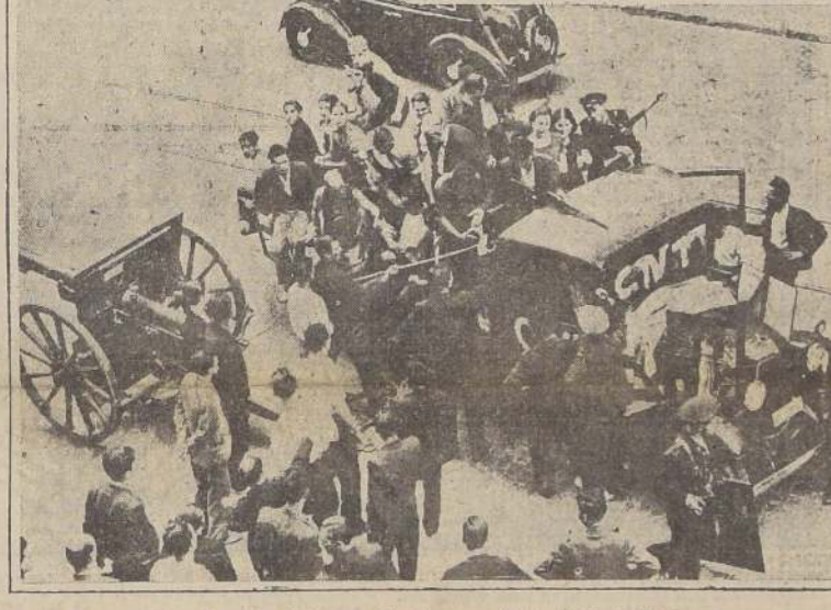
Barcelona. — Automóviles llenos de milicianos y civiles, listos para dirigirse al frente de Zaragoza para resistir a los rebeldes.