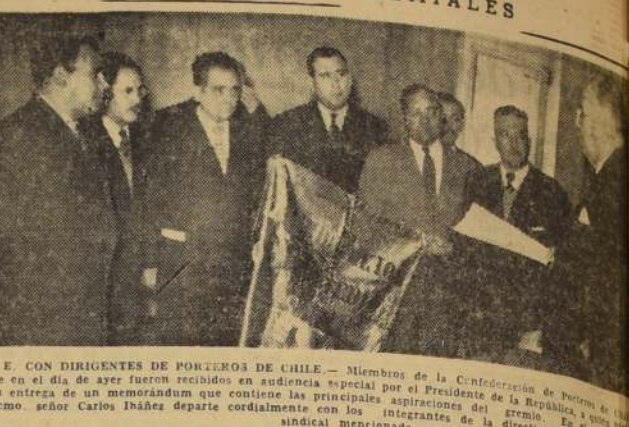
S. E. CON DIRIGENTES DE PORTEROS DE CHILE. — Miembros de la Confederación de Porteros de Chile, en el día de ayer fueron recibidos en audiencia especial por el Presidente de la República, don Carlos Ibáñez de la Cruz, con entrega de un memorándum que contiene las principales aspiraciones del gremio. En el momento de la recepción, don Carlos Ibáñez departe cordialmente con los integrantes de la directiva de la corporación sindical mencionada.