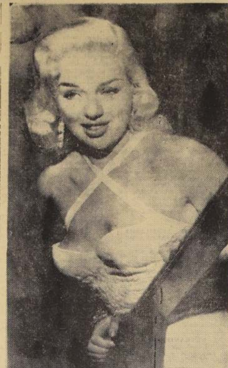
NEW YORK. — He aquí a la estrella británica de la pantalla, Dian Dors (que ha sido llamada "la Marilyn Monroe inglesa"). Ayer llegó a Nueva York en viaje a Hollywood, donde espera escalar la celebridad gracias a sus innegables atractivos personales.