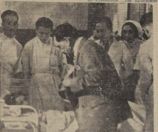
S. E. el Presidente de la República, con afectuosa solicitud se impone del estado de una de las hospitalizadas.

S. E. el Presidente de la República, que se encuentra vivamente preocupado del estado de salud de los numerosos heridos que han llegado a esta ciudad, desde las zonas devastadas por el terremoto del 24 de enero, continuó en la mañana de ayer su visita a los establecimientos hospitalarios donde éstos son atendidos.