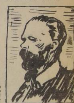
Victor Manuel II

leans se hubiera podido casar en Filadelfia con la joven que amaba. Pero era durante la revolución francesa y el real viajero estaba muy pobre. En hombre práctico, el padre de la joven le negó al que fue más tarde rey de los franceses diciéndole que no era un buen partido.