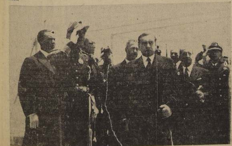
El Presidente de la República, Ministros de Estado y acompañantes, en los momentos en que es saludado con la Canción Nacional, al llegar a bordo del buque insignia de la Escuadra Argentina.