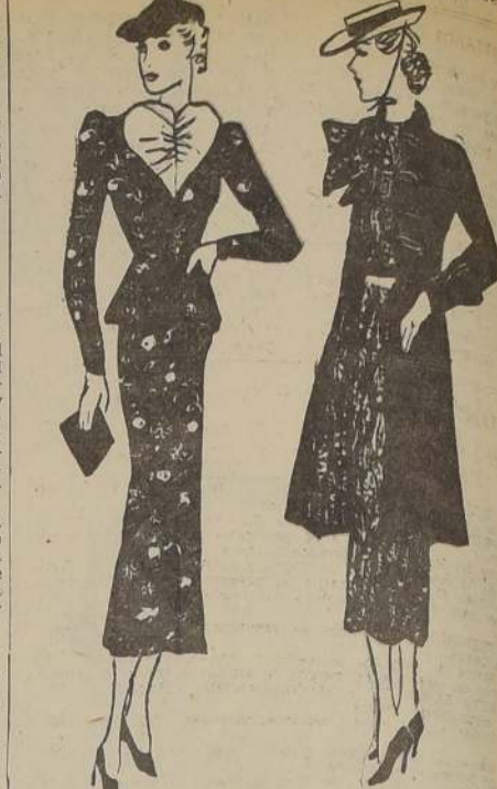
Vestido en crepe de algodón imprimé, con blusita de organdi blanco.