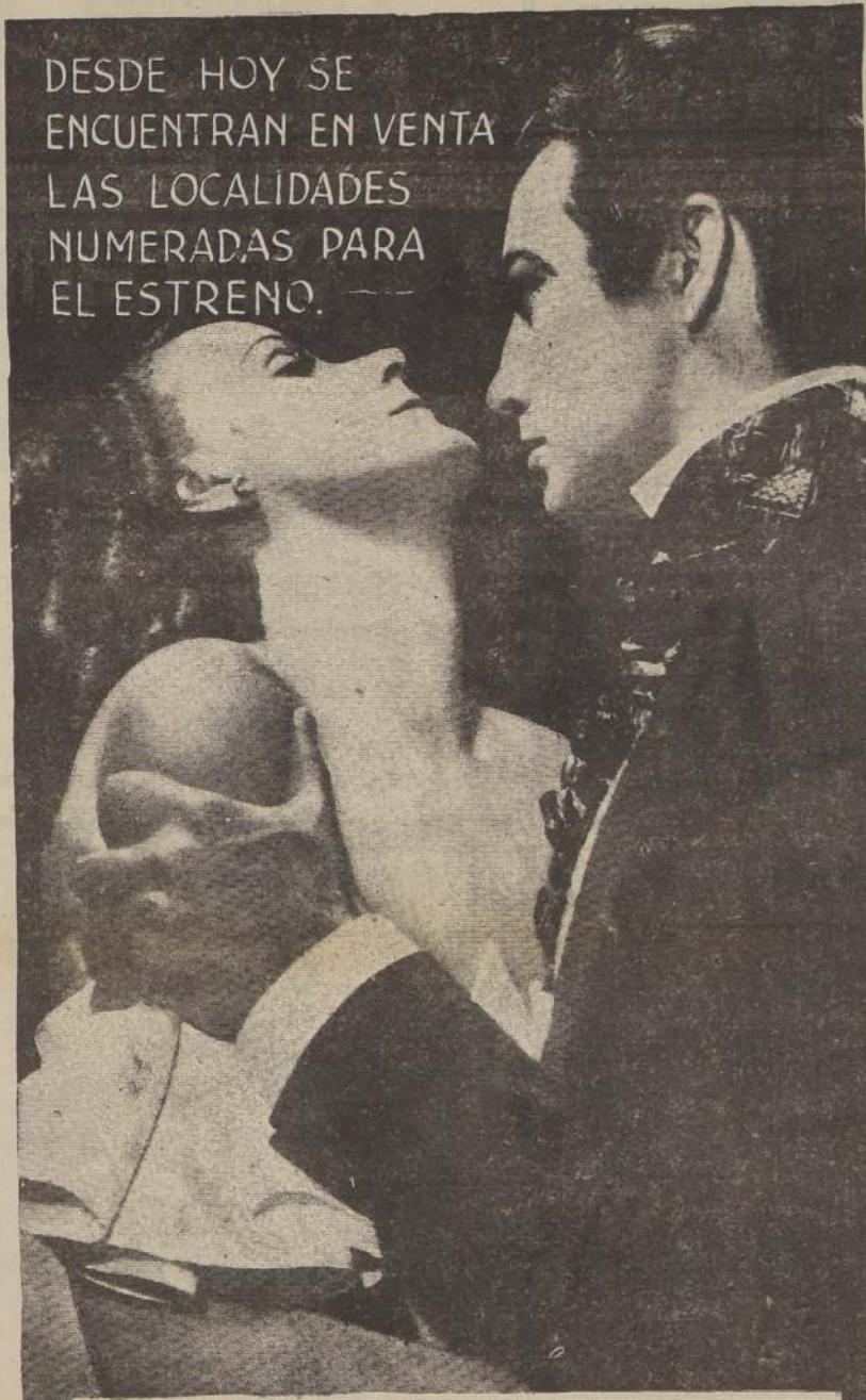
Greta GARBO con Robert TAYLOR

DESDE HOY SE ENCUENTRAN EN VENTA LAS LOCALIDADES NUMERADAS PARA EL ESTRENO.