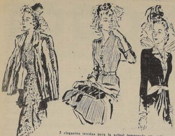
3 elegantes tenidas para la actual temporada que están muy en boga en Nueva York.