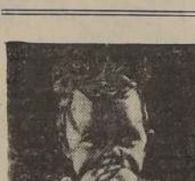
Fuerza, salud y FOSFATINA FALIERES

Un hecho insólito en el servicio, según declara el comunicado oficial emitido por la Panagra, el cual agrega que durante los últimos cinco años la Panagra no ha tenido accidente alguno.