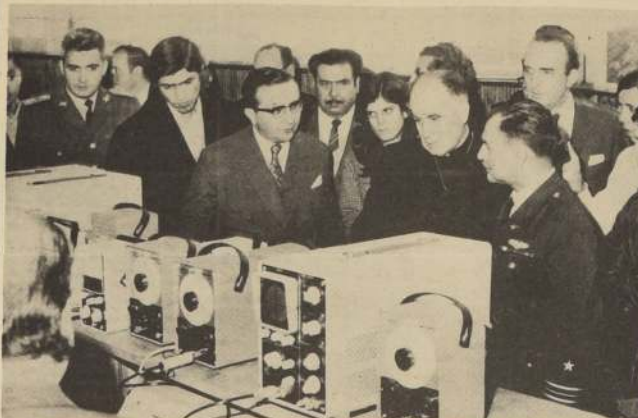
El Ministro de Educación, Máximo Pacheco, el Cardenal Raúl Silva Henríquez y autoridades educacionales atienden a las explicaciones del Coman-

de los establecimientos que están inspirados en la obra de San Juan Bosco. El equipo de laboratorio fue adquirido en Holanda y cuenta con aparatos para construir chasis de radios, audíofonos, generadores para frecuencias, etc.