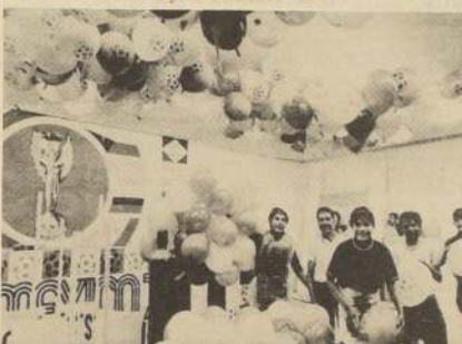
Preparando la ceremonia de la inauguración del campeonato mundial de fútbol. Cientos de niños inflan los globos que serán lanzados al aire el próximo domingo en el Estadio Azteca.

Moore es entrevistado por los periodistas tras su llegada a México.