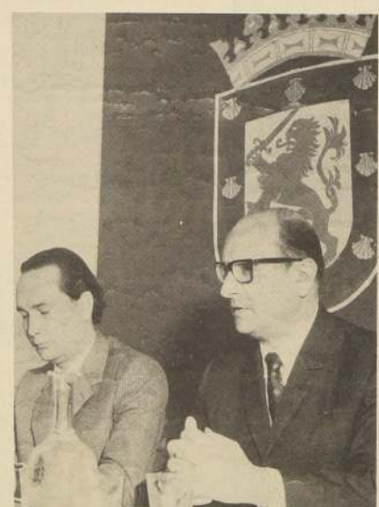
La exposición "Santiago Salta al Futuro", servirá para demostrar que nuestra capital ha dejado de ser un pueblo grande para convertirse en pocos años en una ciudad con perfiles modernos y