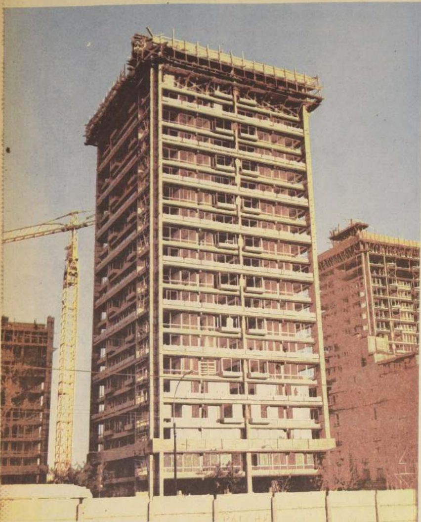
La fotocolor muestra las torres 1, 2 y 3 que construye en la Remodelación San Borja la