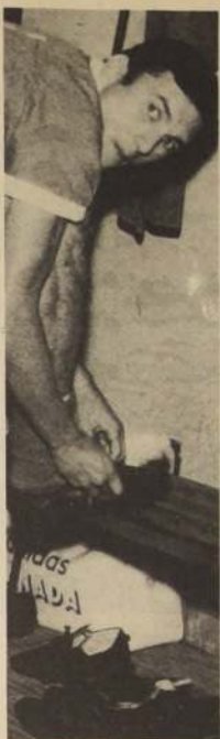
El argentino Spedaletti, reaparece en la "U" en su puesto habitual.