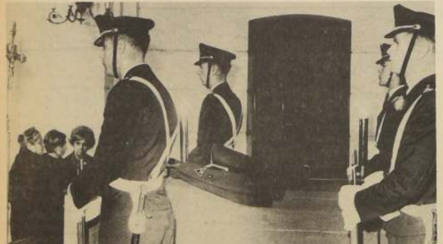
La gorra y el capote del joven aviador descansan sobre su urna. Cuatro ca-

En el momento de efectuarse la sepultura, una Sección con efectivos de la Escuela de Aviación rindió honores con las descargas de ordenanza.