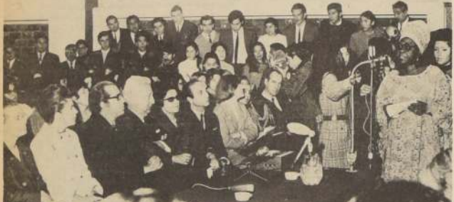
Parte de los asistentes al acto de inauguración del Seminario "La Mujer

La mujer en la Economía Chilena, en la Vida Política y en la Organización Social: "en todos ellos, dijo, ha estado presente aportando capacidad, responsabilidad y constancia en su tarea. Pero aún hay valles de todo tipo que superar".