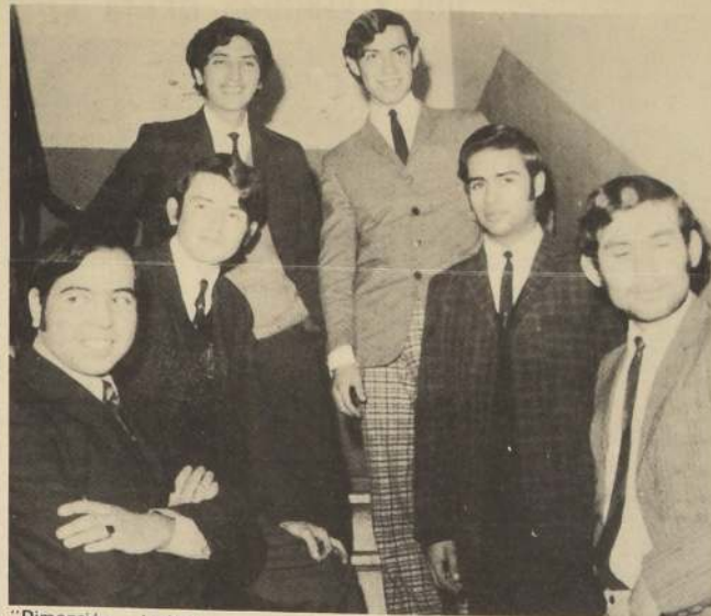
"Dimensión Latina": cinco muchachos con cinco esperanzas.

¡Por fin su primer disco...! desde hace dos años que cantan temas del poeta Humberto Moreno