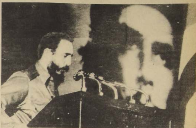
Fidel reconoció el fracaso de la zafra.