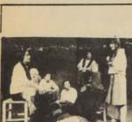
Sigue con gran éxito en el Antonio Varas "los que van quedando en el camino"